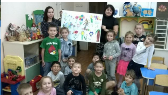
Наш дивный сад