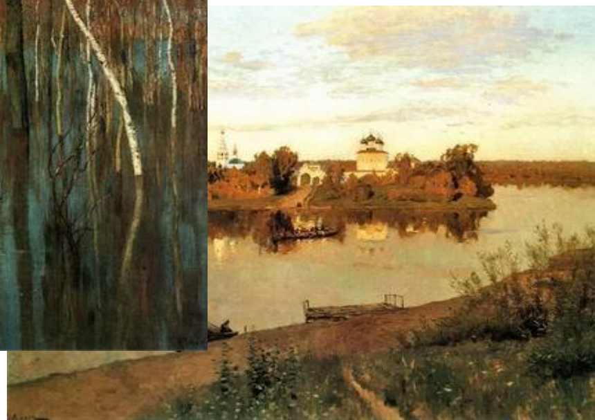
И.И.Левитан «Вечерний звон»