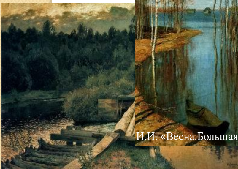
И.И. «Весна. Большая вода»