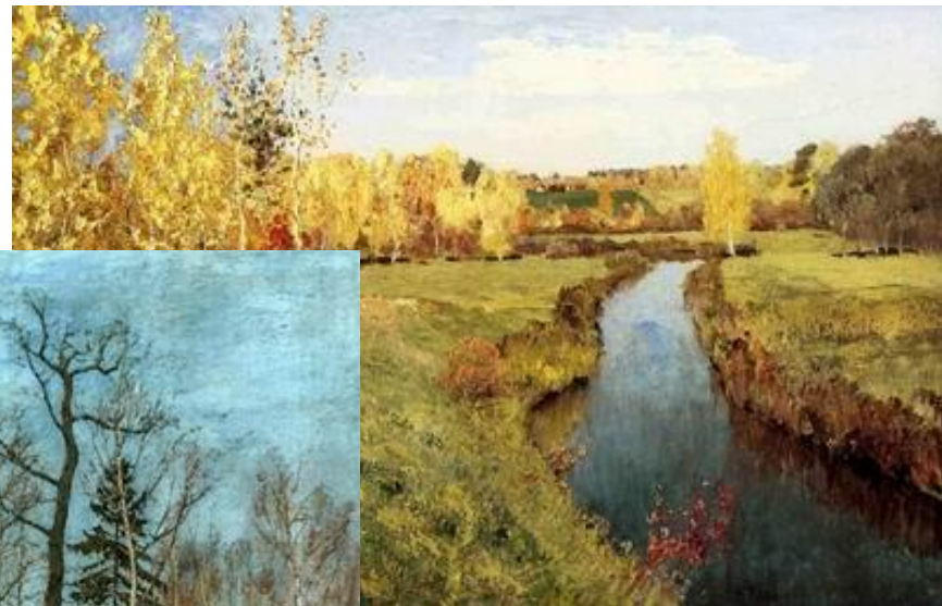
И.И.Левитан «Золотая осень»