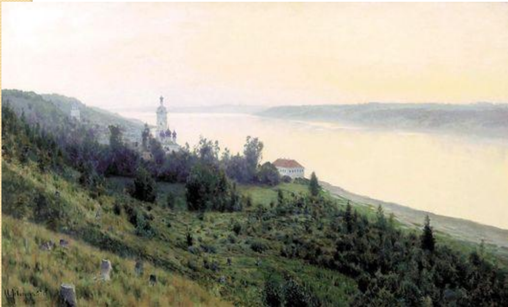
Исаак Ильич Левитан «Вечер. Золотой Плес» Выставлена в музее: Третьяковская галерея