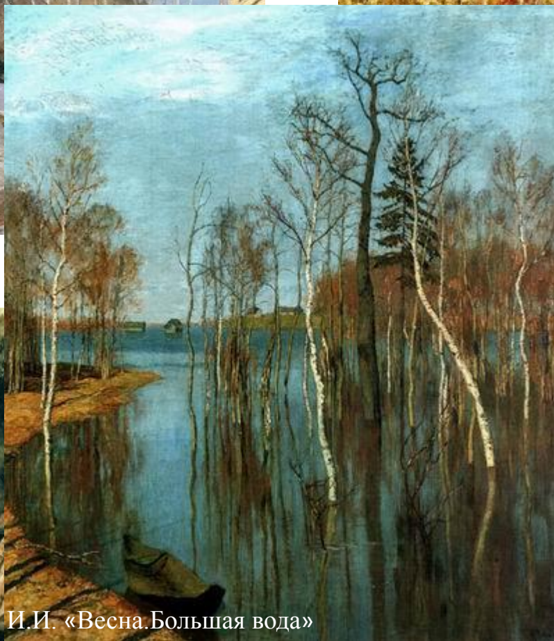
И.И. «Весна. Большая вода»