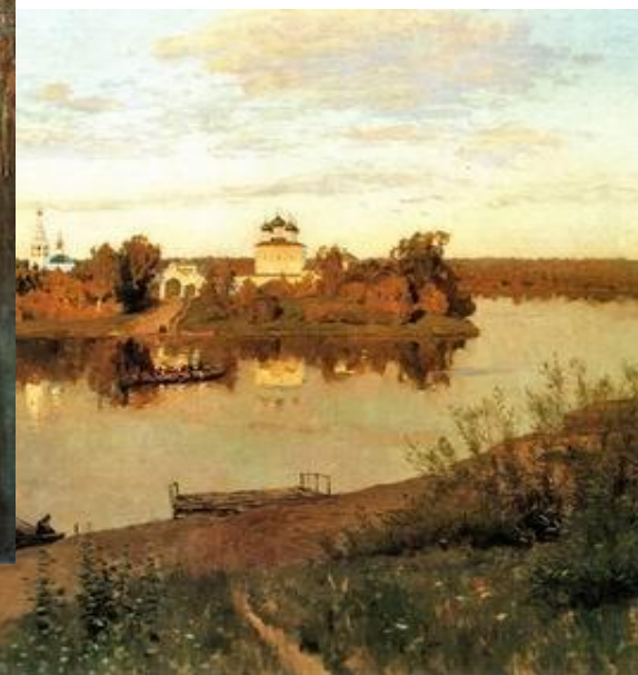
И.И.Левитан «Вечерний звон»