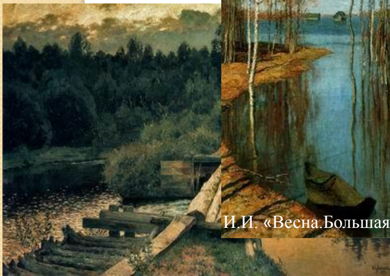
И.И.Левитан «У омута»