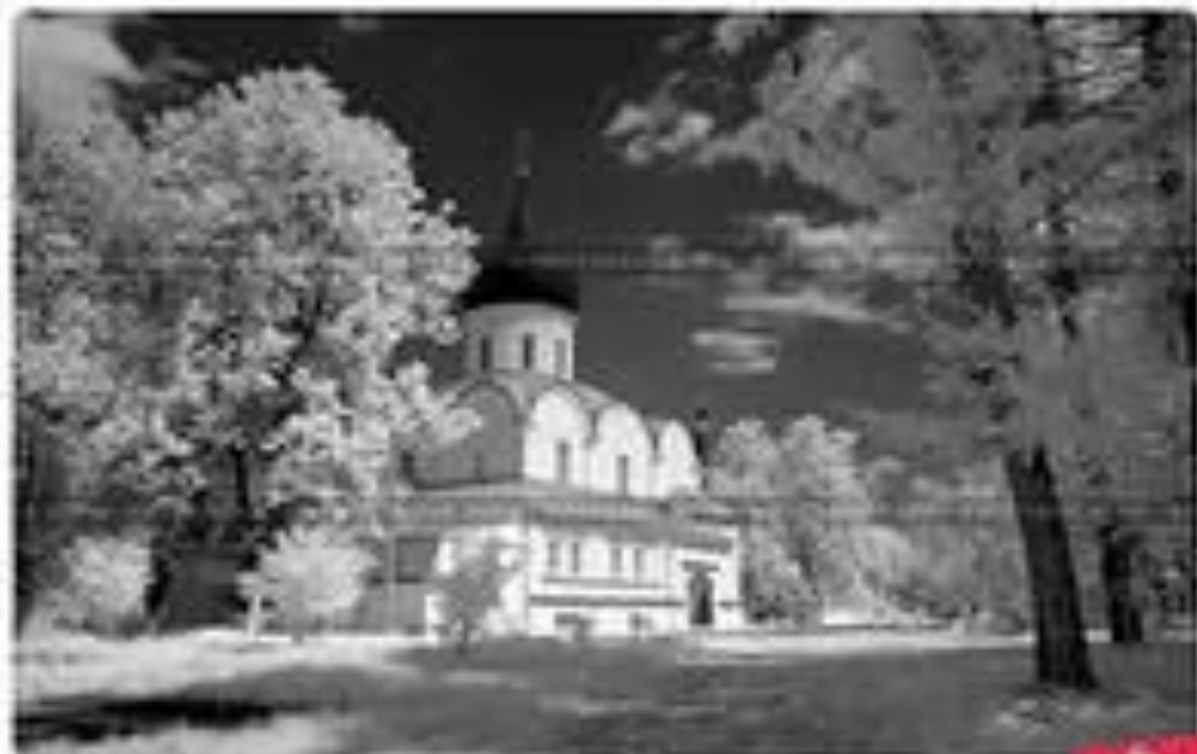
Музей-заповедник "Александровская Слобода", Троицкий собор, Инфраструктура