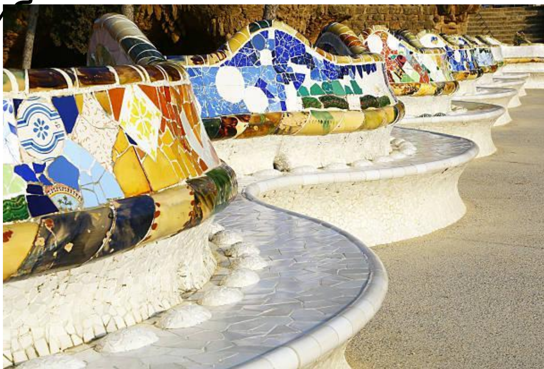
Скамейка в парке (Барселона)

Одни здания напоминают гребень высоко взметнувшейся гигантской волны, фасады других волнообразно изги