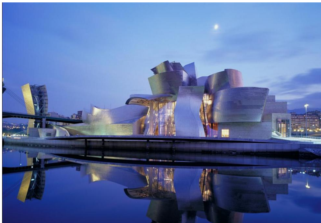
Музей Гуггенхайма (Бильбао)

Черепица в форме волны надёжно защищает крышу, так как по образующимся желобкам легко стекает дождевая вода.