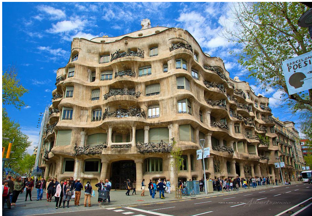
А.Гауди. Жилой дом (Барселона)

Форма волны широко используется для проектирования зданий, крыш, садово-парковых объектов, элементов оборудования территории и др.