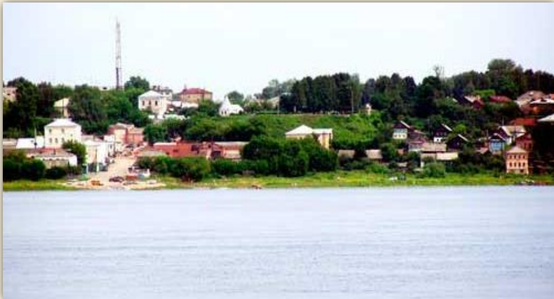
Вид Городца с Волги

Роспись, которая ныне называется городецкой, родилась в Поволжье. Леса давали дешевый и разнообразный материал, изделия из которого крестьяне отвозили продавать на ярмарку в село Городец. Поэтому роспись, выполненная на этих изделиях, получила название Городецкая .