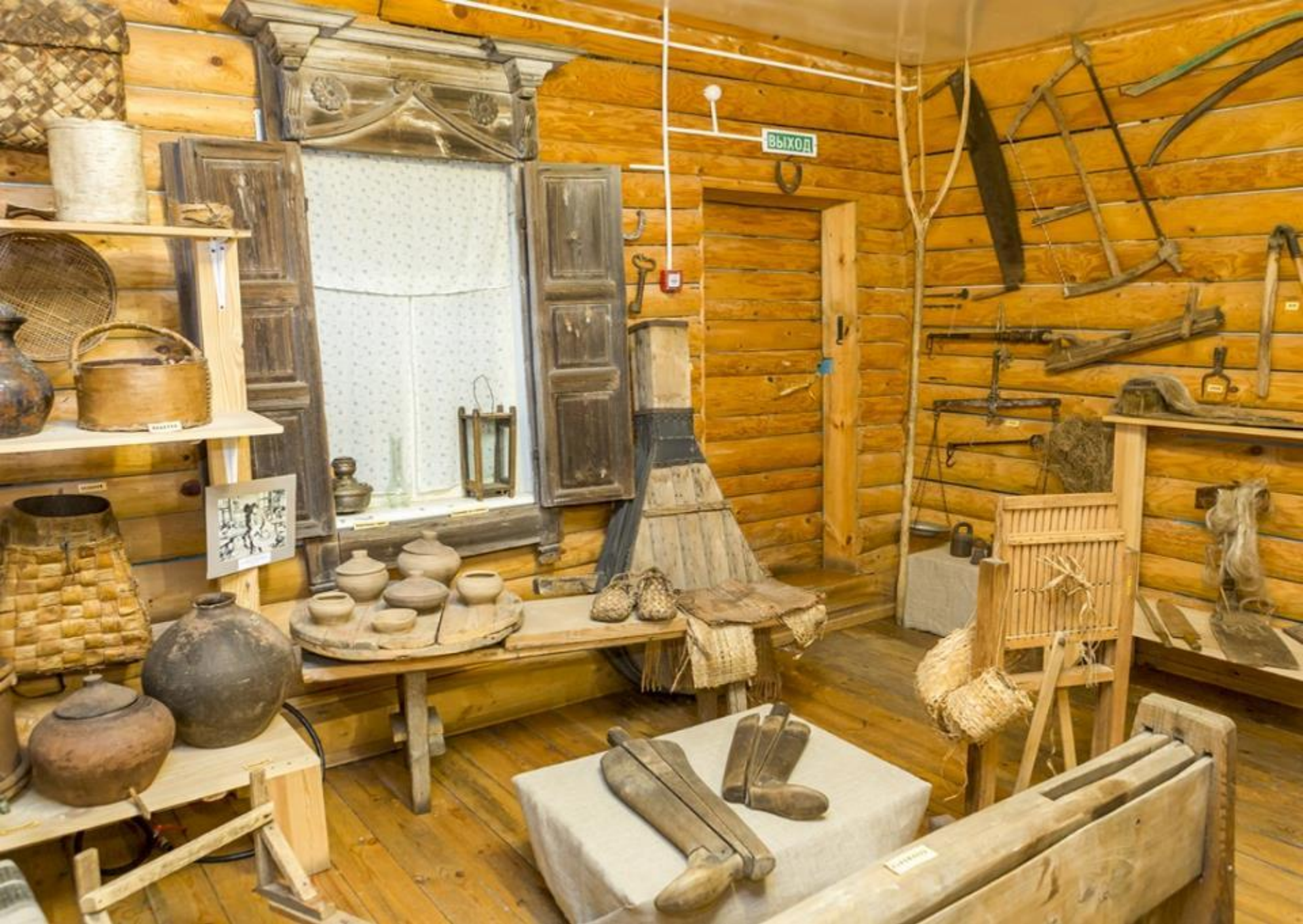
Музей в Городце