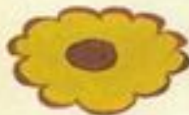
Flower No. 13