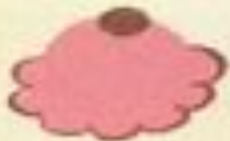
Flower No. 4