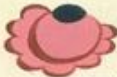
Flower No. 20a (pink) and 20b (red) — not shown