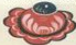
Flower No. 3