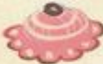
Flower No. 6