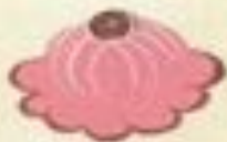
Flower No. 5