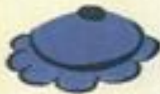
Flower No. 18