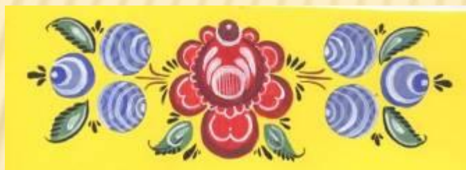
Купавка и бутон