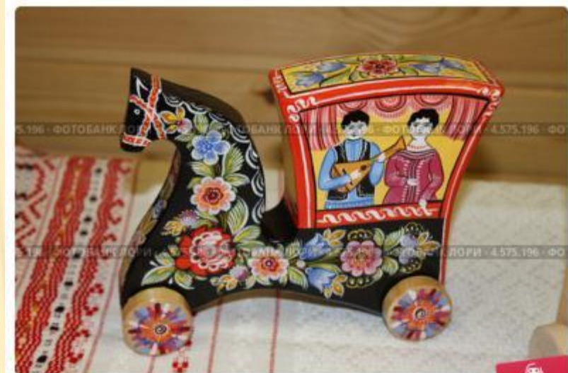
Городецкая игрушка