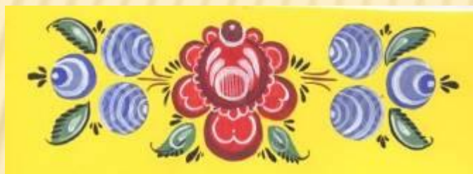
Купавка и бутон