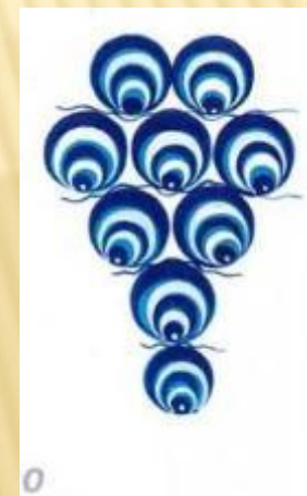
Ягодки и бубенчики