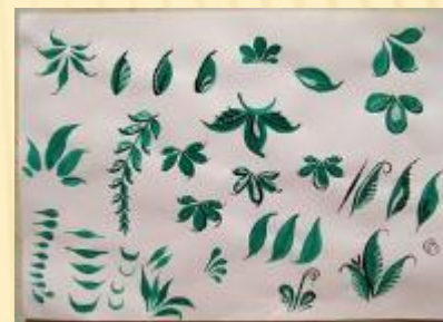
Листья и кустики