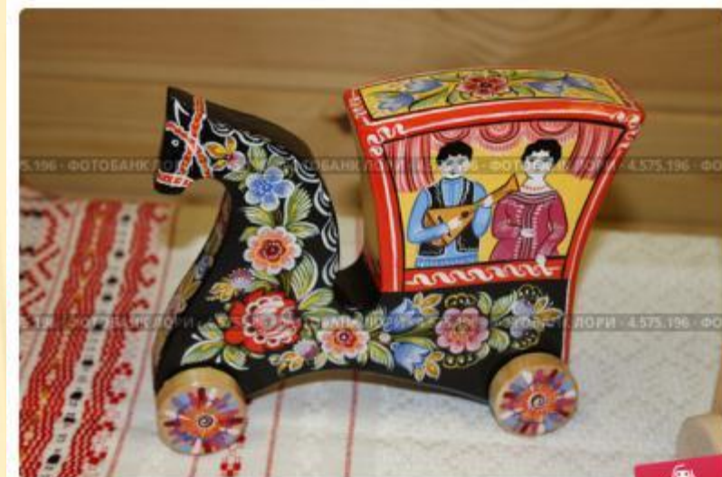
Городецкая игрушка