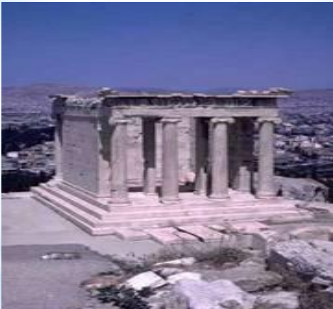
Храм Ники Аптерос. Ионический ордер