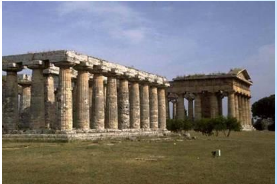
Храм Геры в Пестуме. Дорический ордер