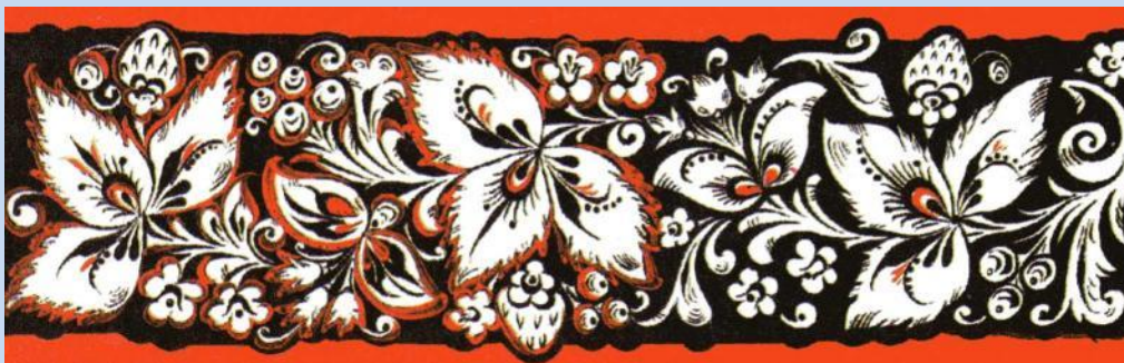
Разновидность фонового письма – « кудрина»