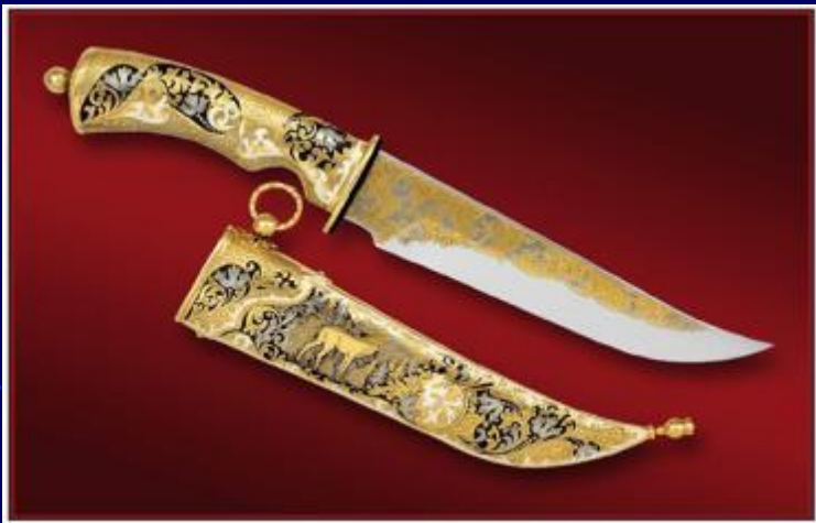
Оружие Златоустовских мастеров