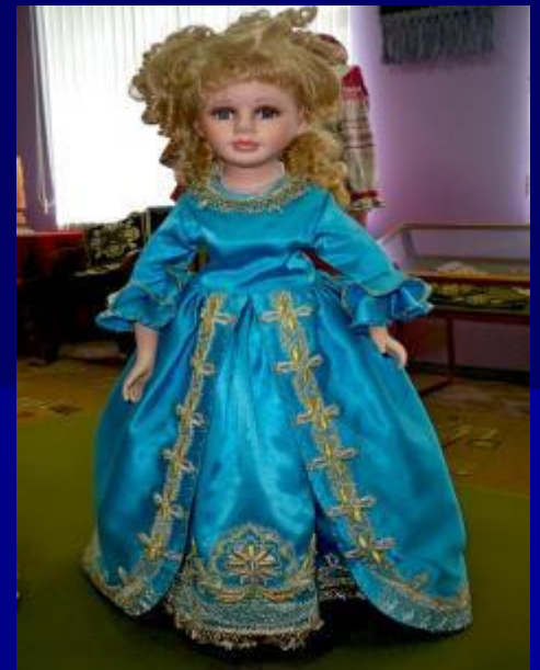
Торжокское золотое шитье