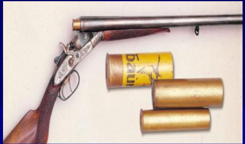
Оружие Тульских мастеров