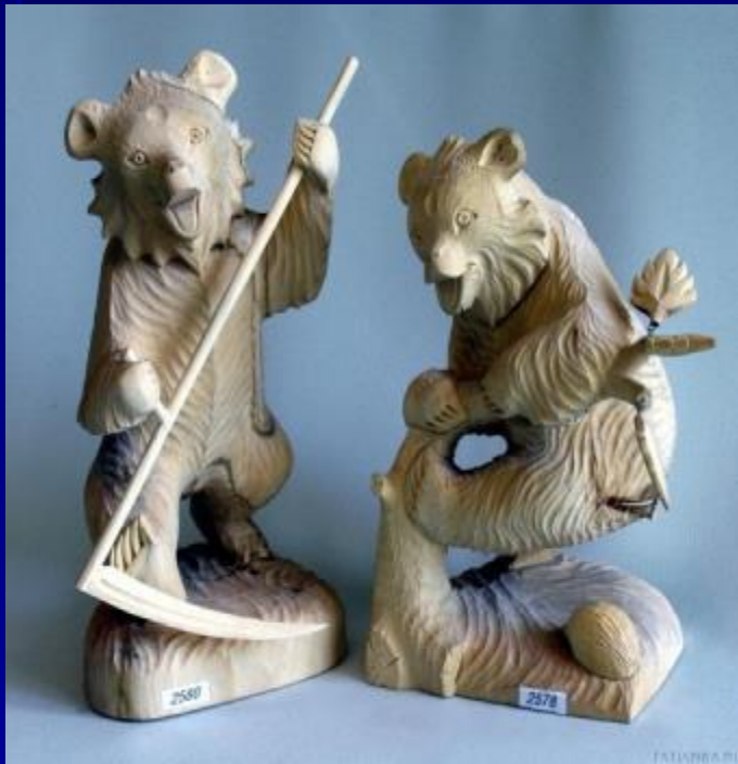
Богородская резьба по дереву