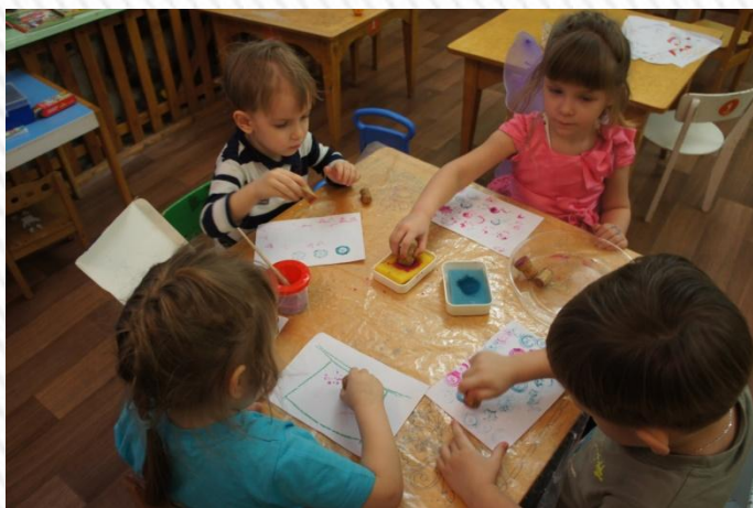
Прием обыгрывания игрушек

Создание игровой ситуации с элементами игры-драматизации для возникновения сюжетно-игрового замысла