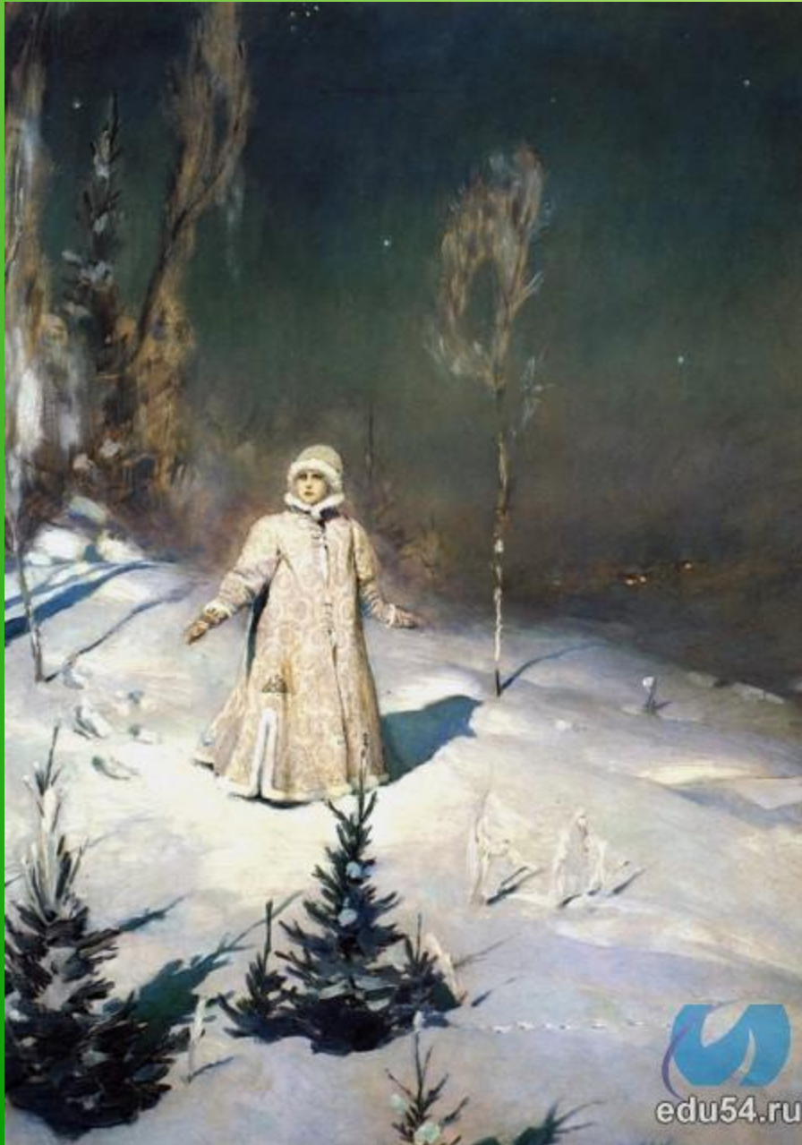
В. Васнецов. Снегурочка