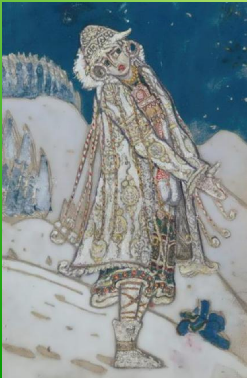
М. Врубель. Снегурочка