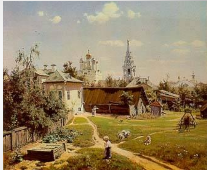
Поленов Василий Дмитриевич Московский дворик. 1878