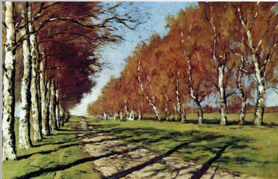
И.И.Левитан Солнечный день. Большая дорога.