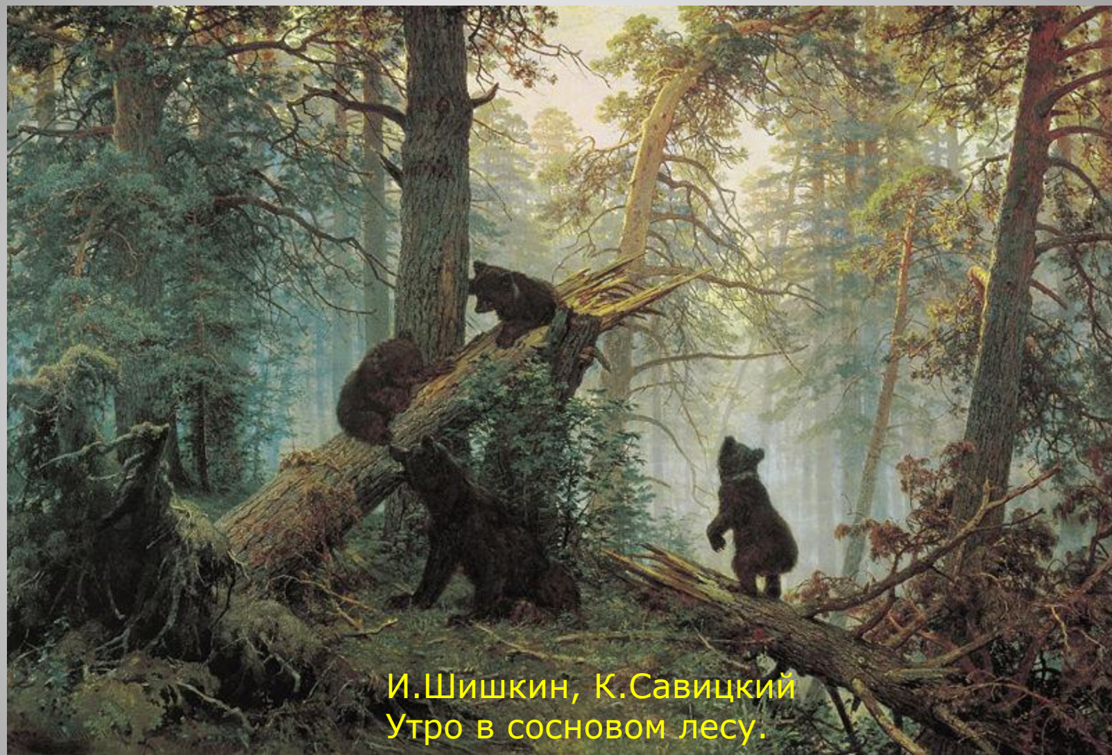
И.Шишкин, К.Савицкий Утро в сосновом лесу.