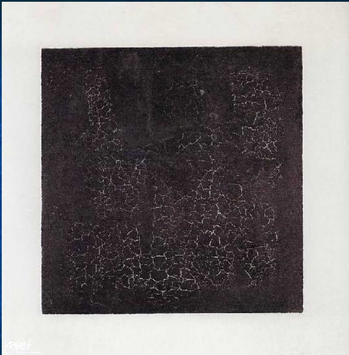
Черный супрематический квадрат