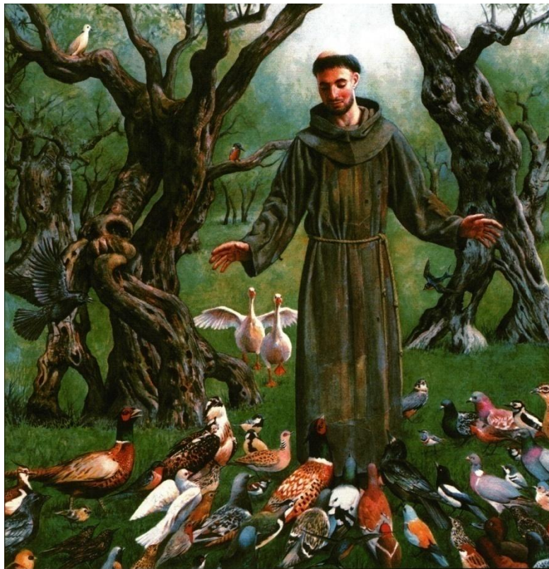
Деннис НОЛАН. Святой Франциск беседует с птицами. 2005 г.