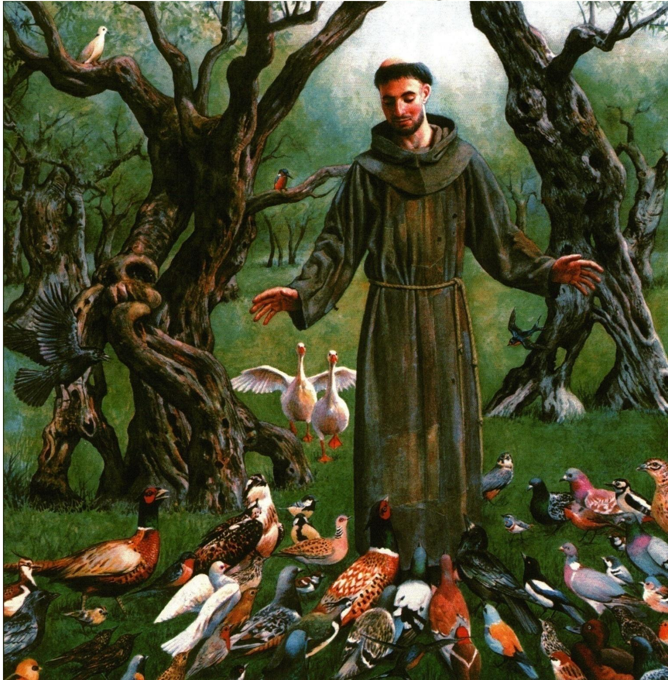
Деннис НОЛАН. Святой Франциск беседует с птицами. 2005 г.