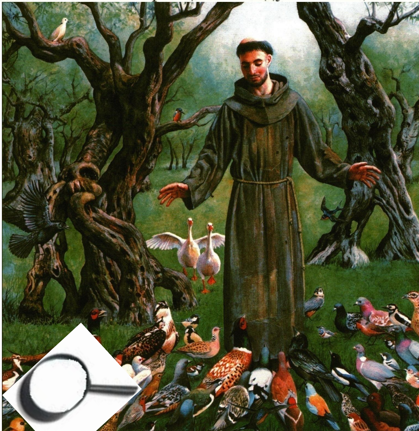
Деннис НОЛАН. Святой Франциск беседует с птицами. 2005 г.