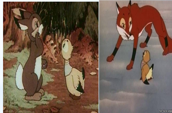
Серая шейка, заяц, лиса