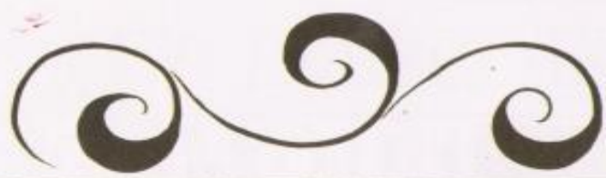
ВЕДУЩИЙ СТЕБЕЛЬ — «КРИУЛЬ»