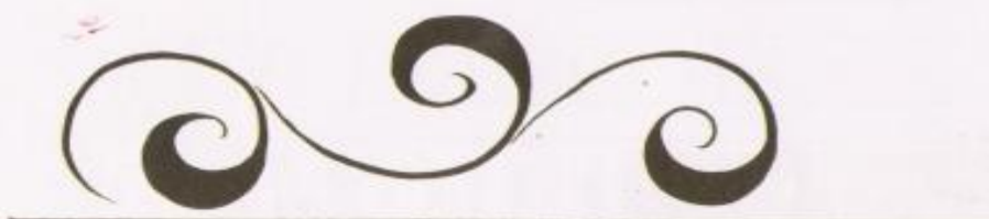
ВЕДУЩИЙ СТЕБЕЛЬ — «КРИУЛЬ»