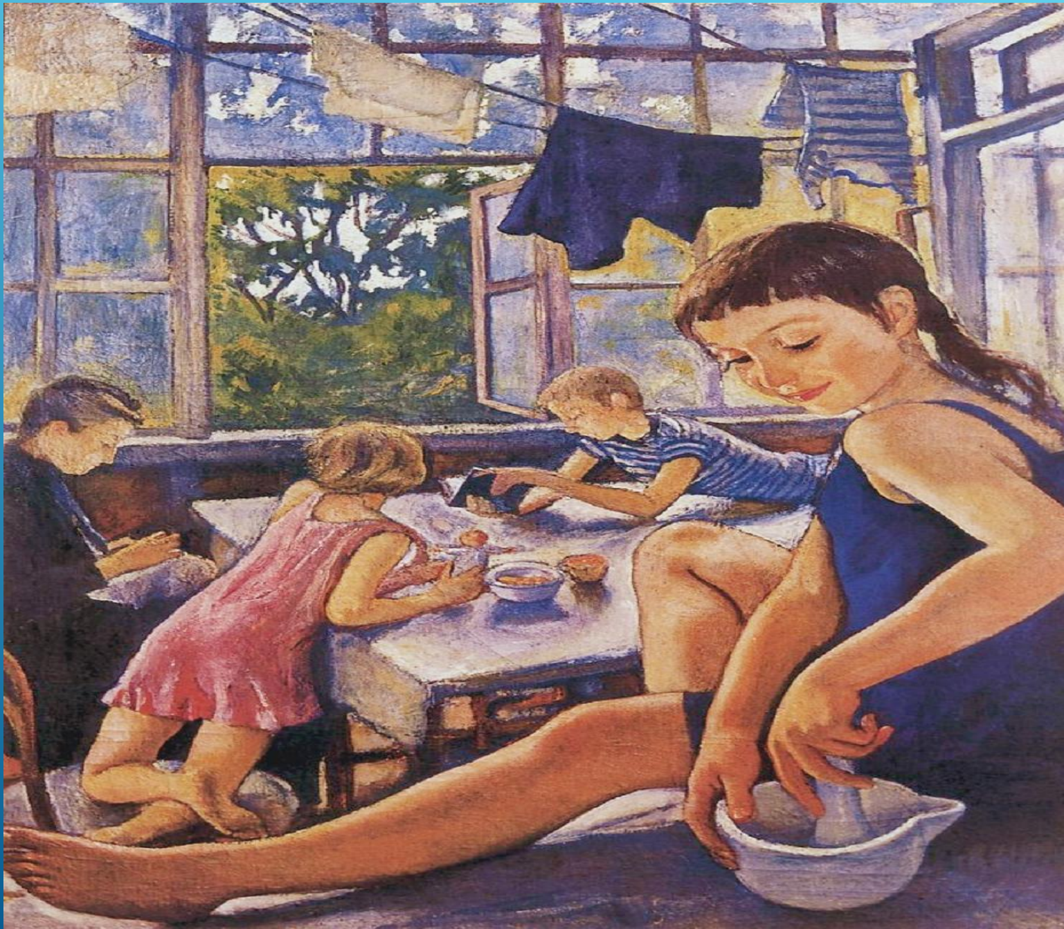
З.Серебрякова «На террасе в Харькове».