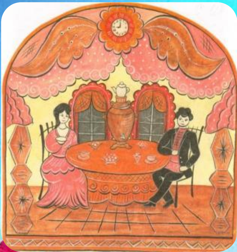
Эскизы росписи «Свидание»