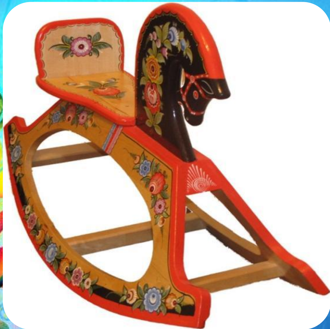
Конь - качалка