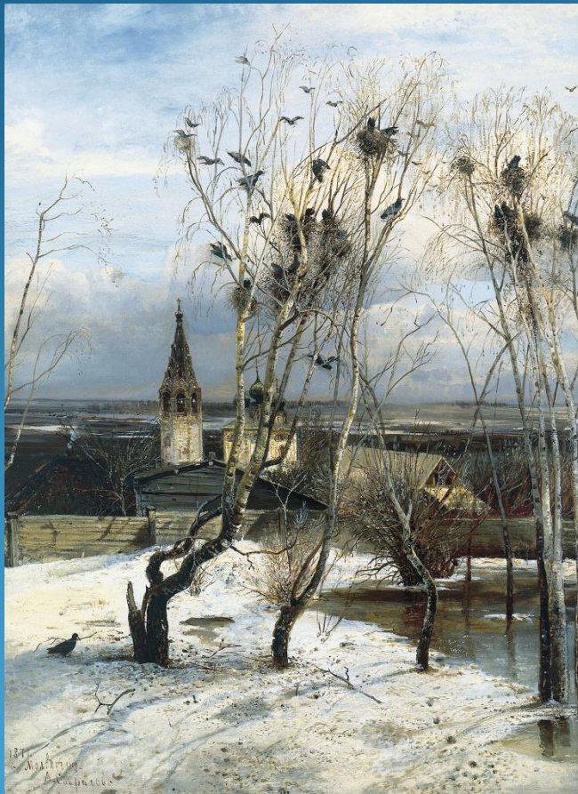
Саврасов А.К. «Грачи прилетели»