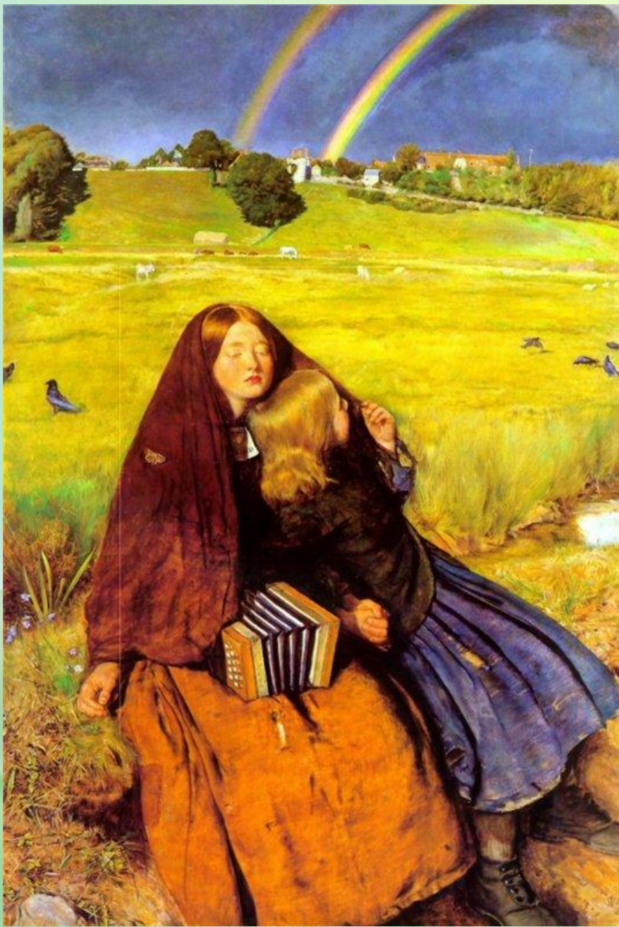
Джон Эверетт Миллес