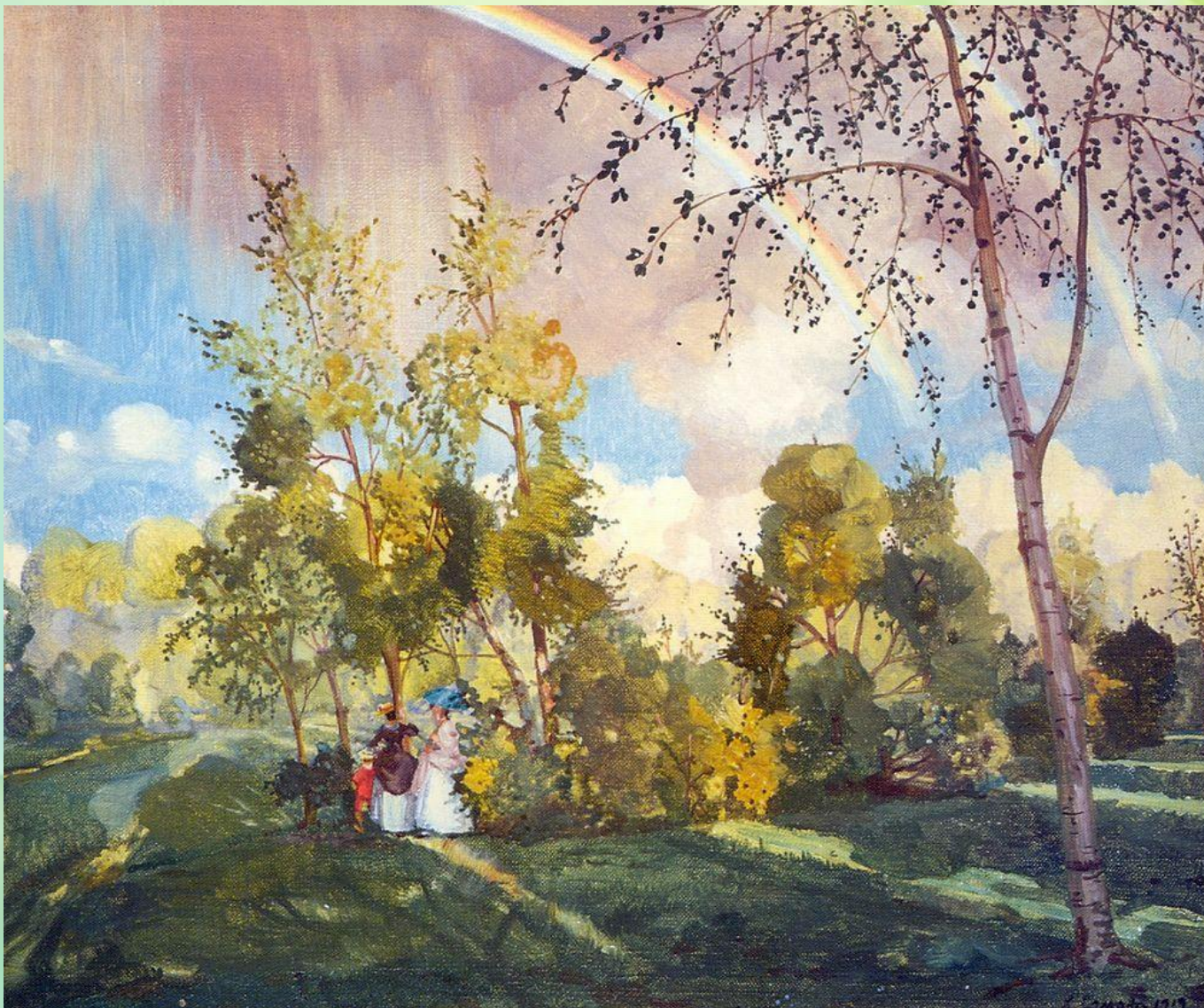
Константин Андреевич Сомов