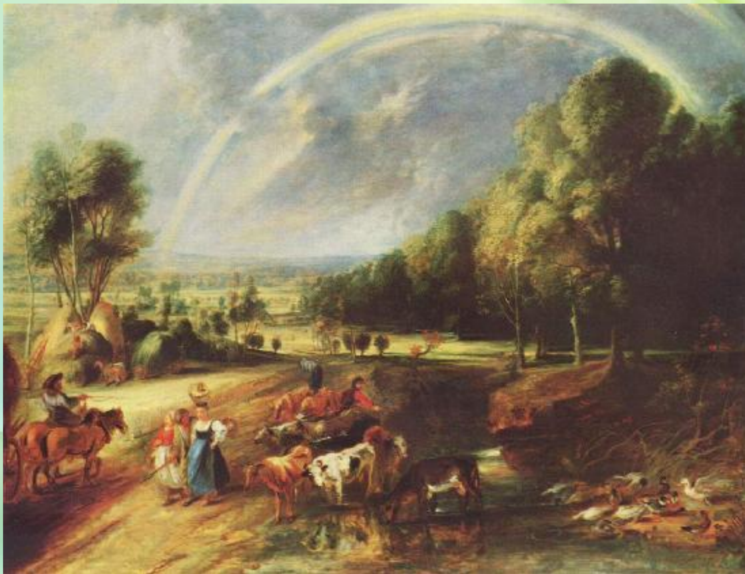
Питер Пауль Рубенс