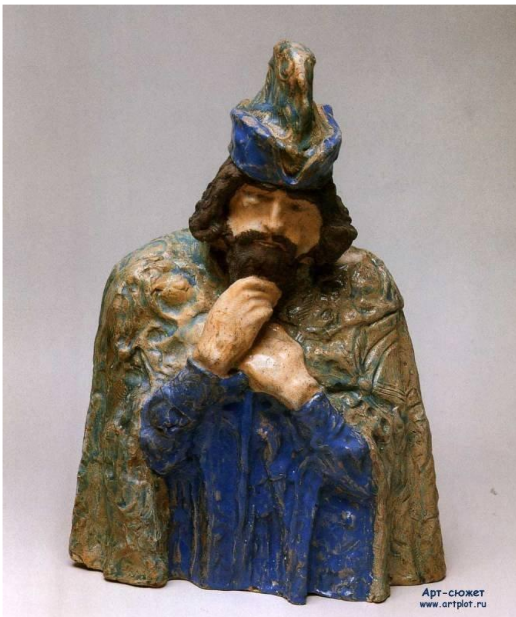
Майолика М.Врубеля Царь Берендей