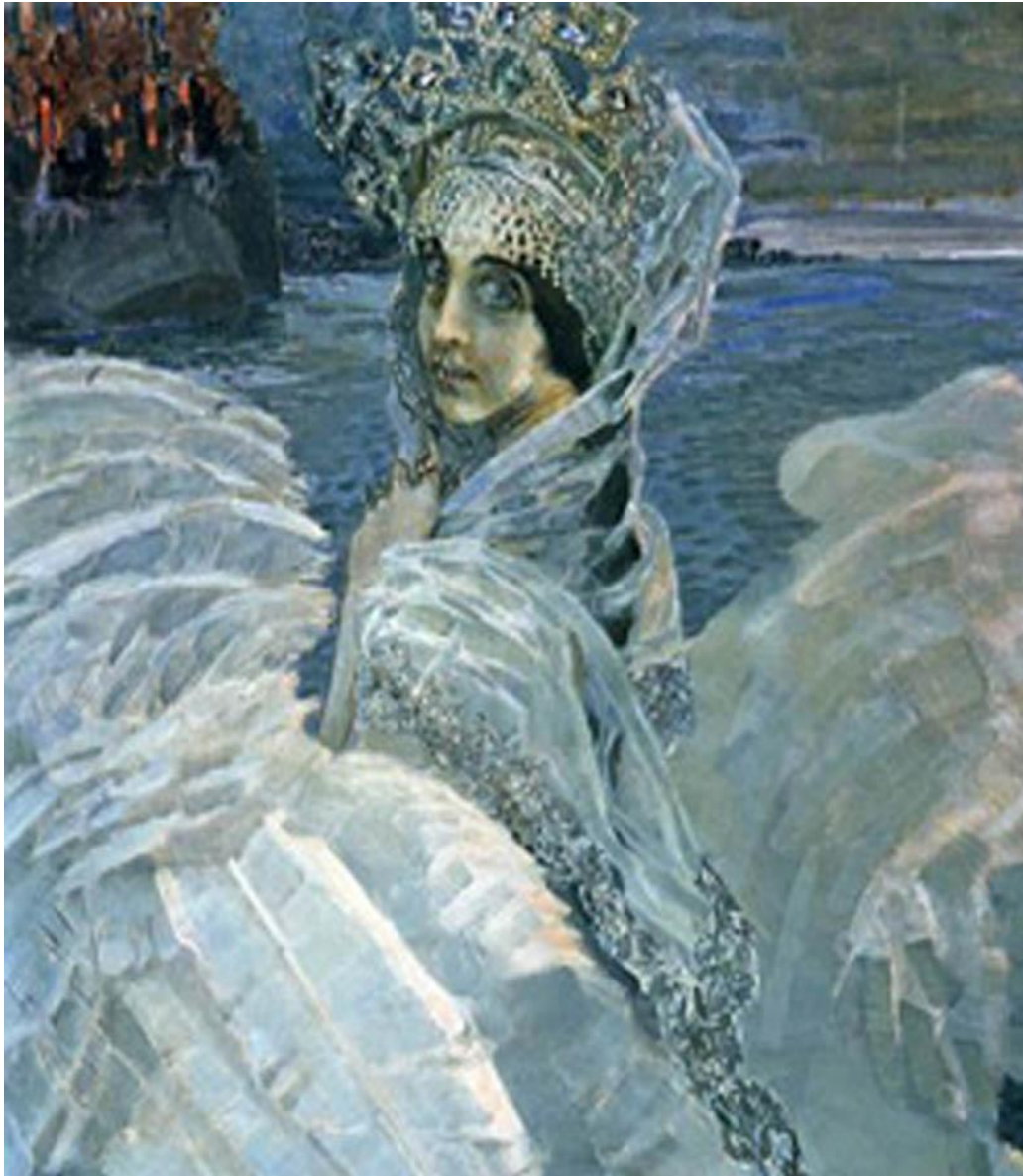
М.Врубель «Царевна - Лебедь»