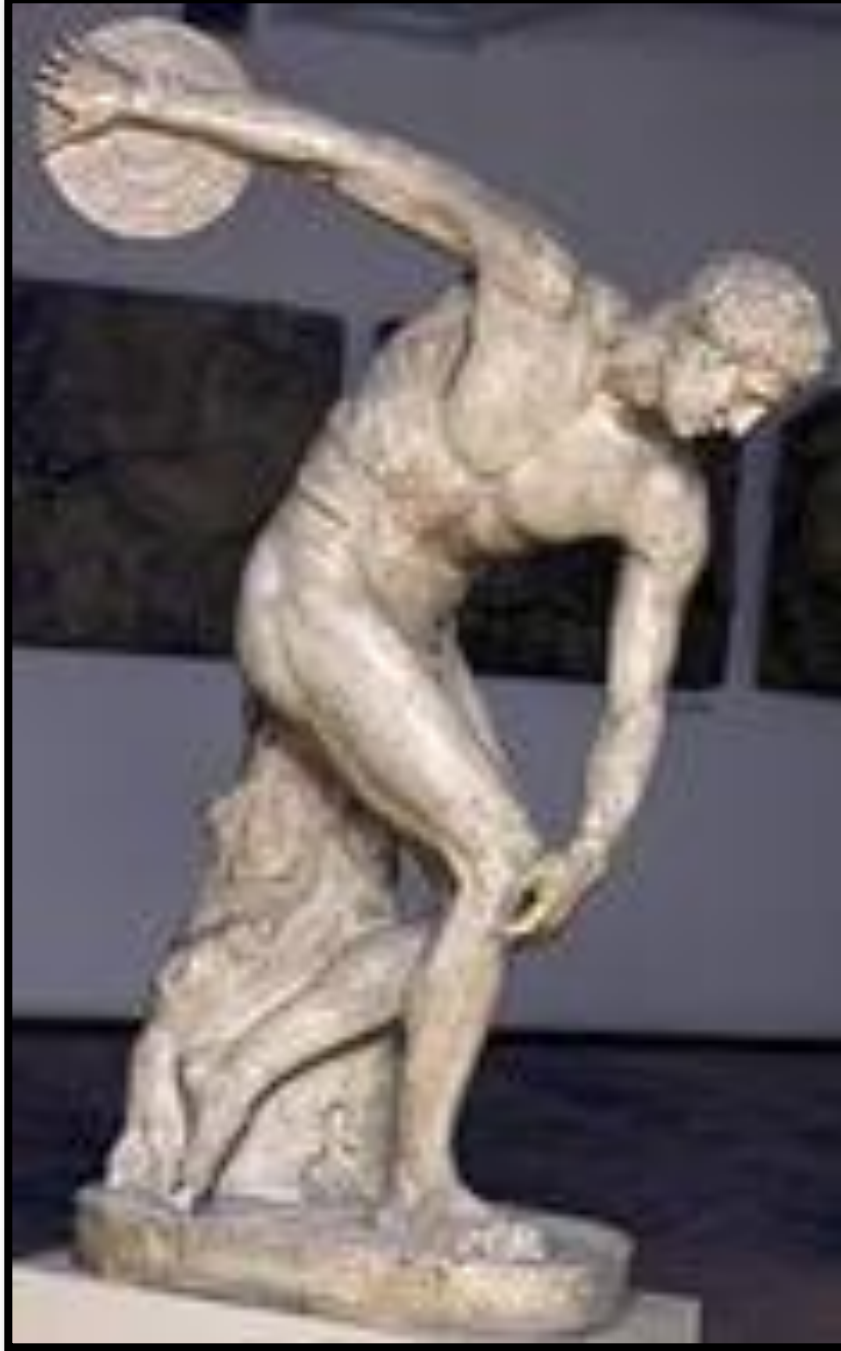
• Метатель диска •