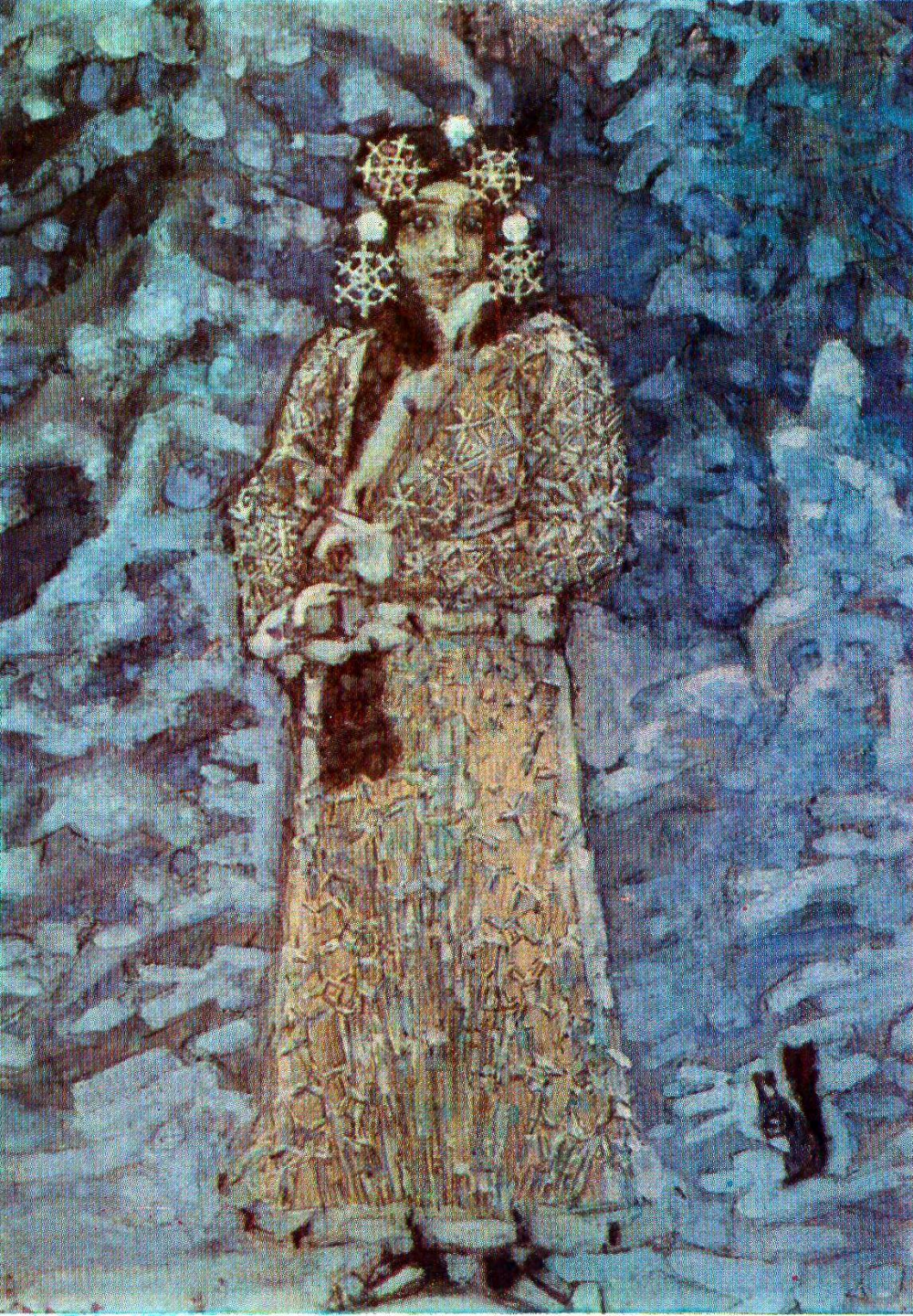
«Снегурочка» Михаил Врубель (1890 год)