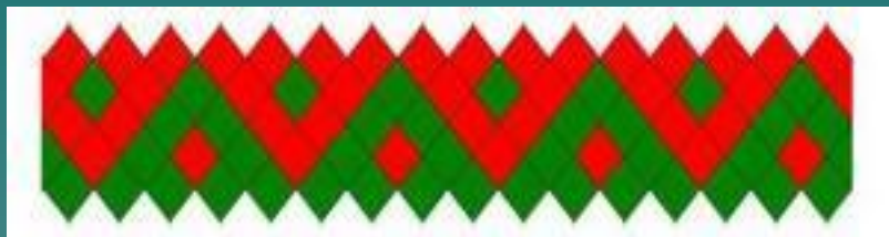
Шовыр пал «заячы ушки»