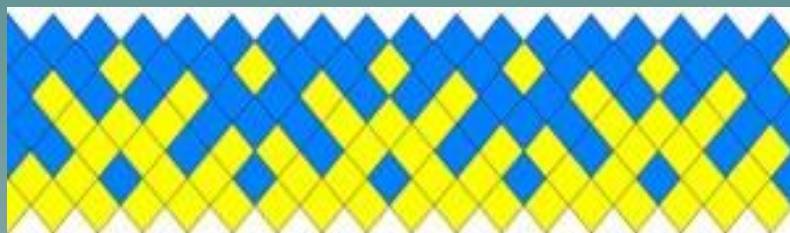
Питы лук «глухарь»