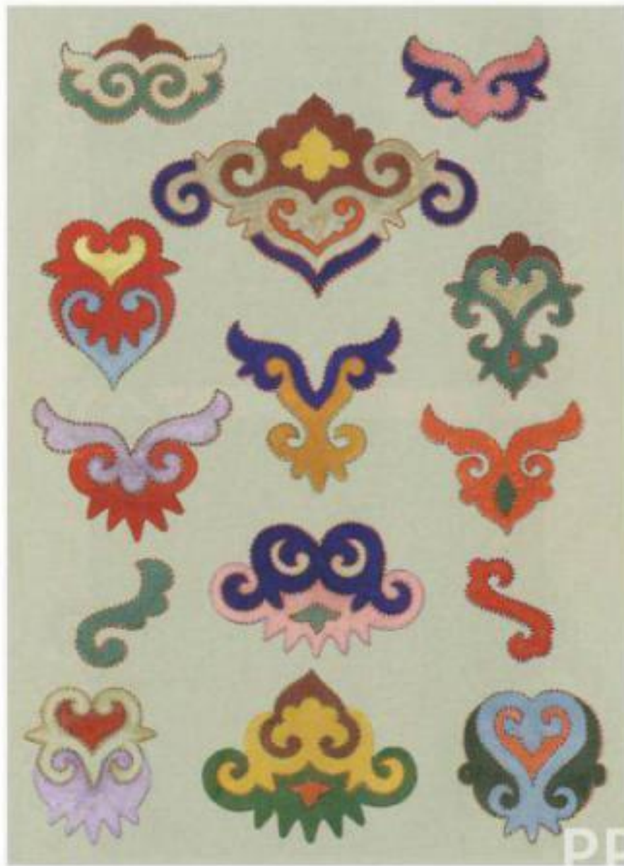
Figure 1.15: A collection of colorful, stylized decorative motifs arranged in a grid-like pattern on a light background. The motifs feature intricate scrollwork, floral elements, and symmetrical designs in various colors including red, blue, yellow, green, purple, and pink.