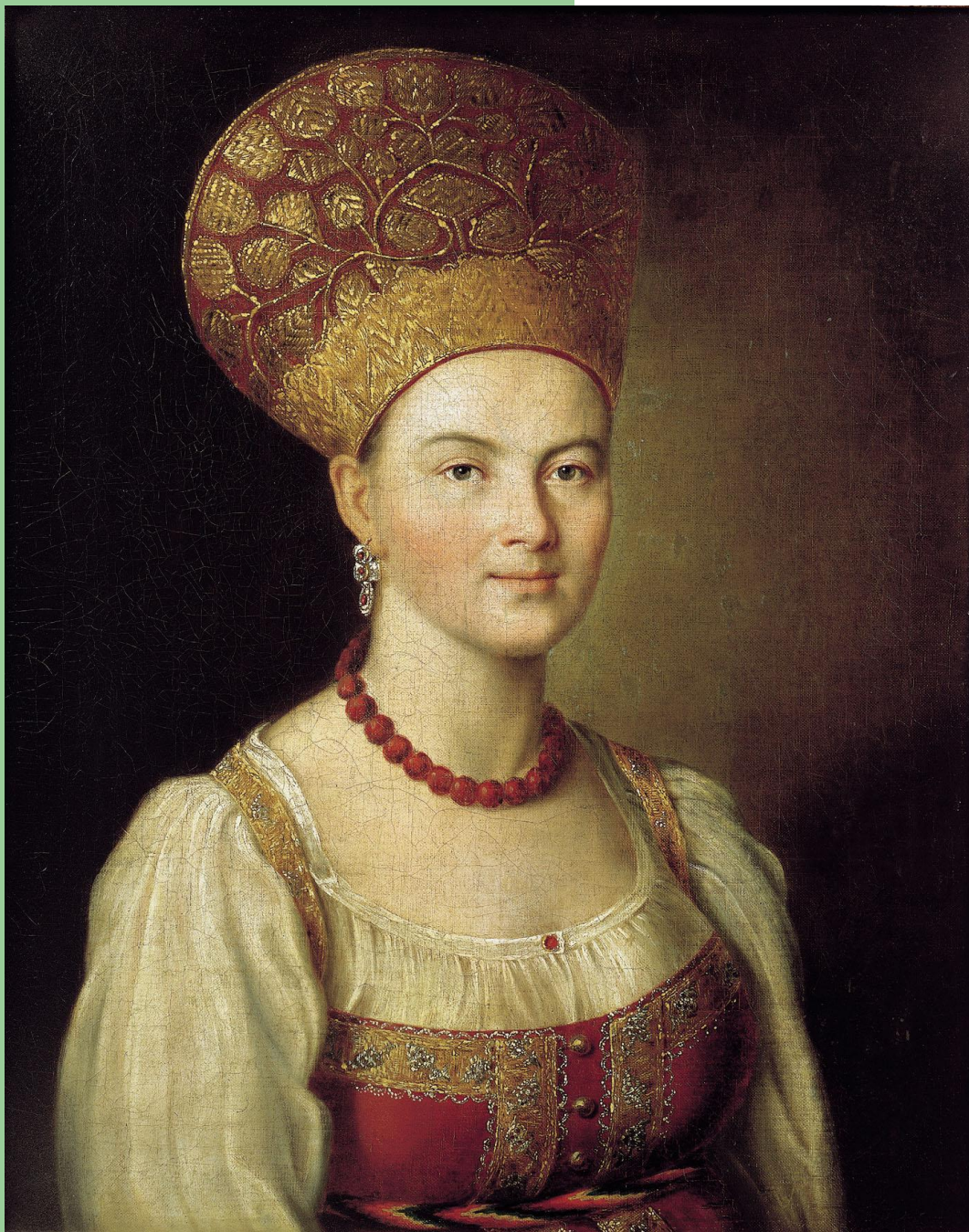
И. Аргунов «Портрет неизвестной крестьянки в русском костюме»