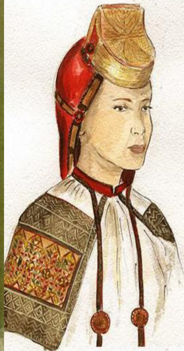
Головной убор "сорoka" Воронеж конец 19 начало 20 века. (сукно, бархат, золотное шитье, гапун)