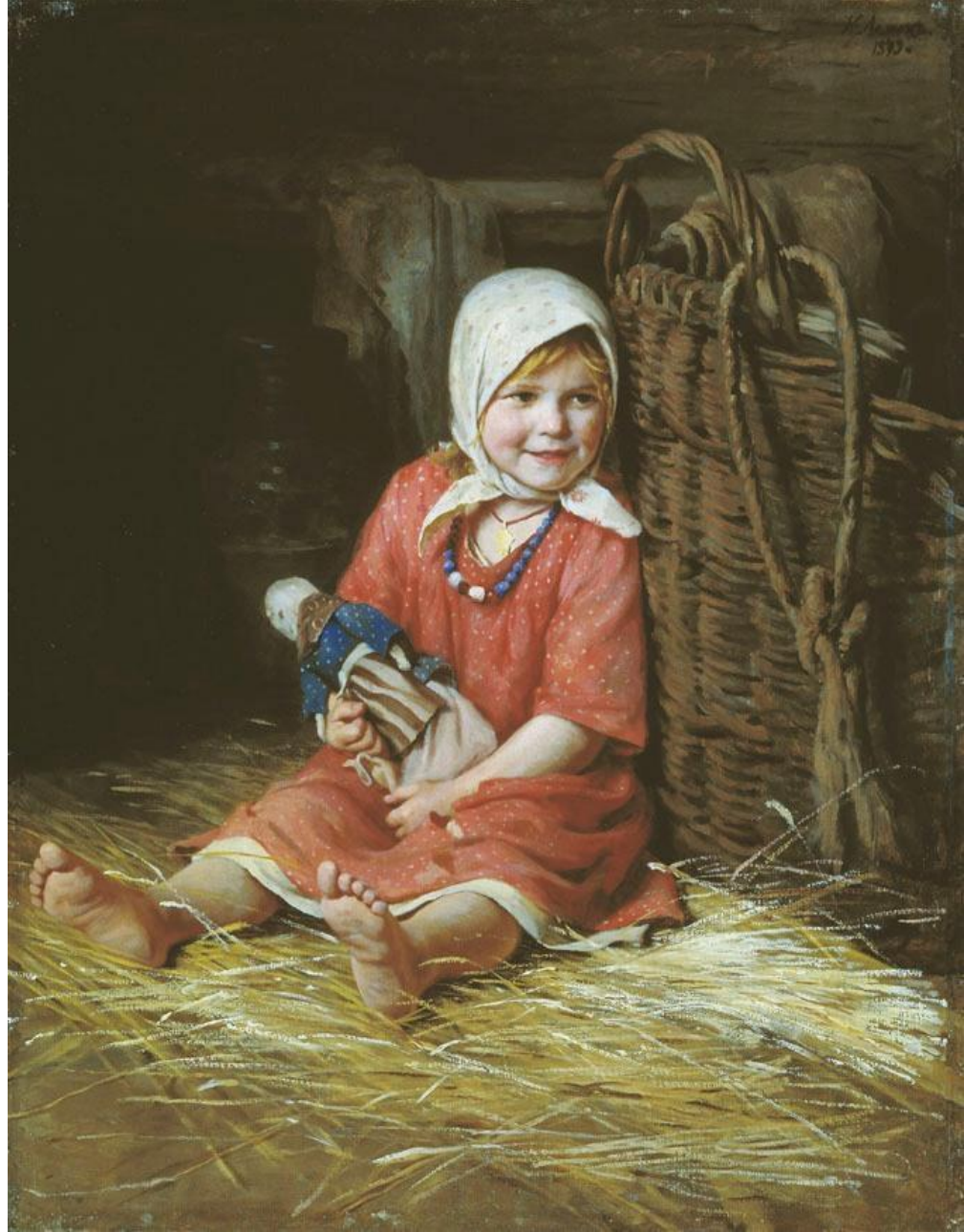
Лемох Карл (Кирилл) Викентьевич (1841-1910) «Варька» 1893

Многие художники изображали детей с куклами. И у разных народностей были свои куклы.