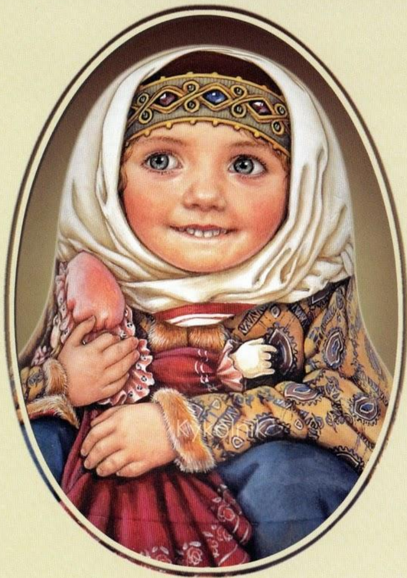
Людмила Романова. Почтовая карточка «Открытое письмо»