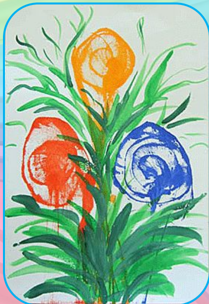
НИТКИ + акварель