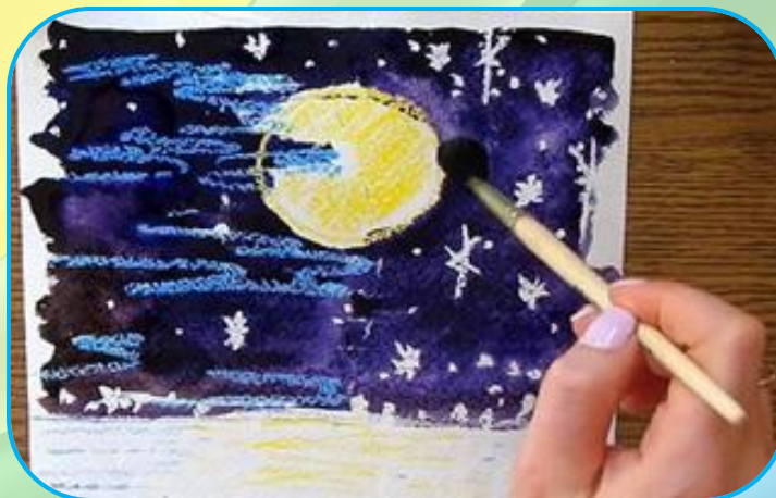
восковые мелки + акварель