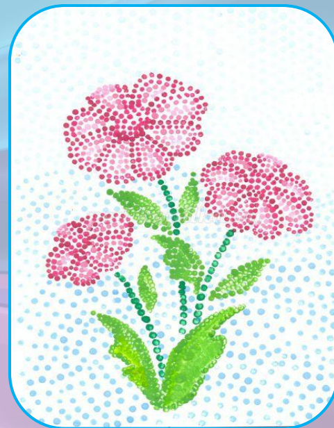
рисование ватными палочками