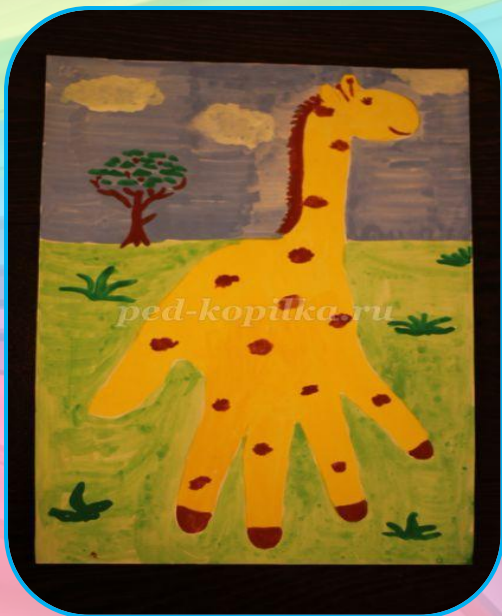
рисунки из ладошки