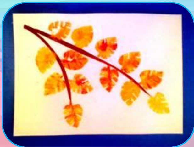
оттиск печатками из картофеля