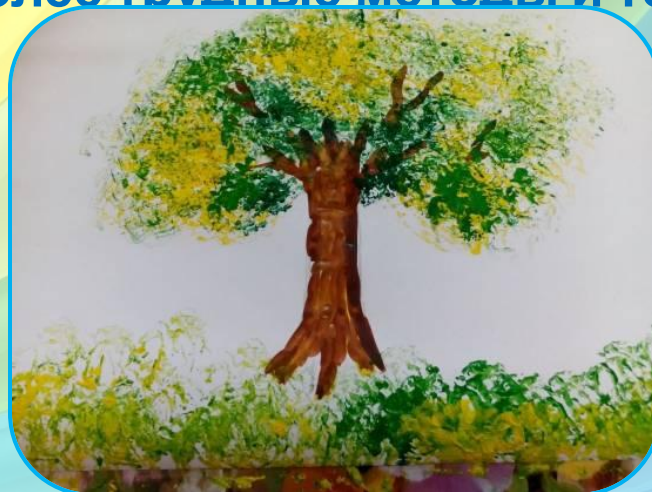
рисование мятой бумагой

А в старшем дошкольном возрасте дети могут освоить еще более трудные методы и техники: