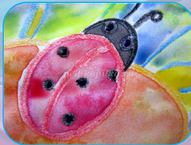
свеча + акварель