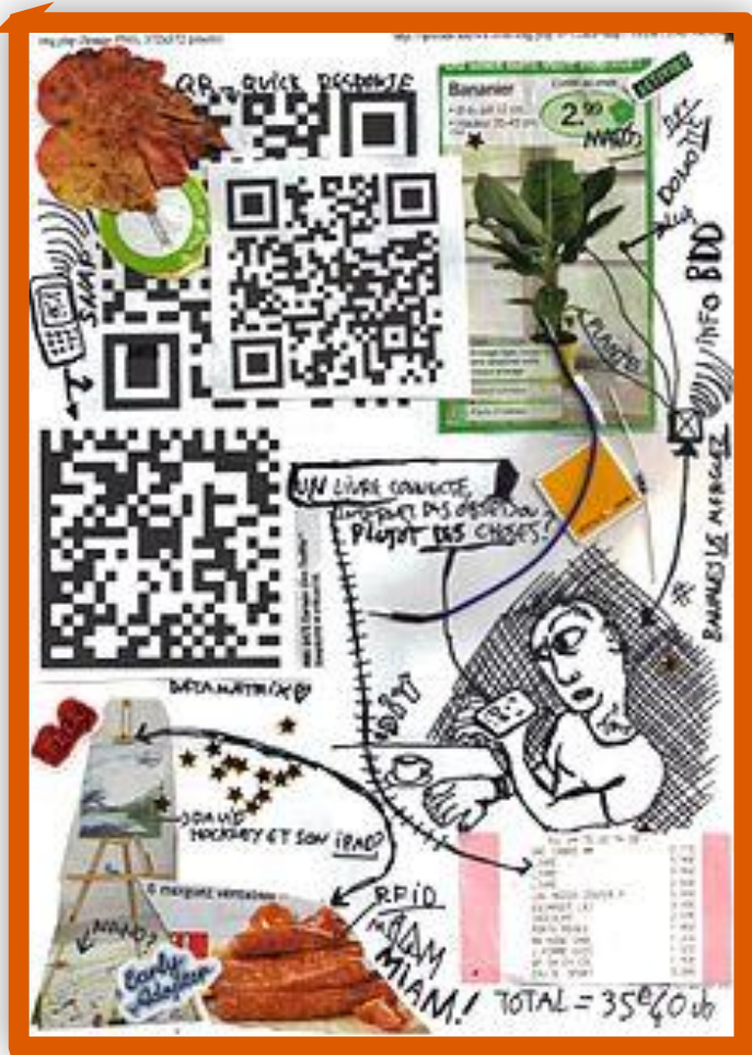
Коллаж «интернет вещей»