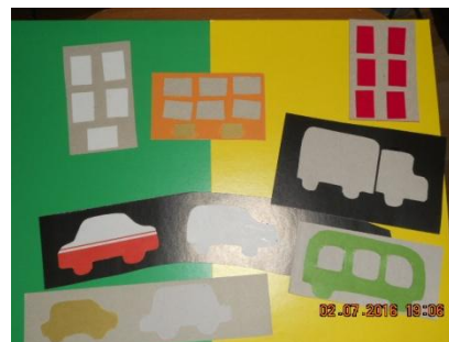
Дома и транспорт