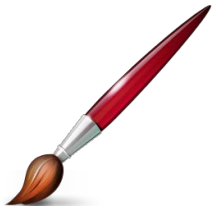
Рисунок кончиком пастели