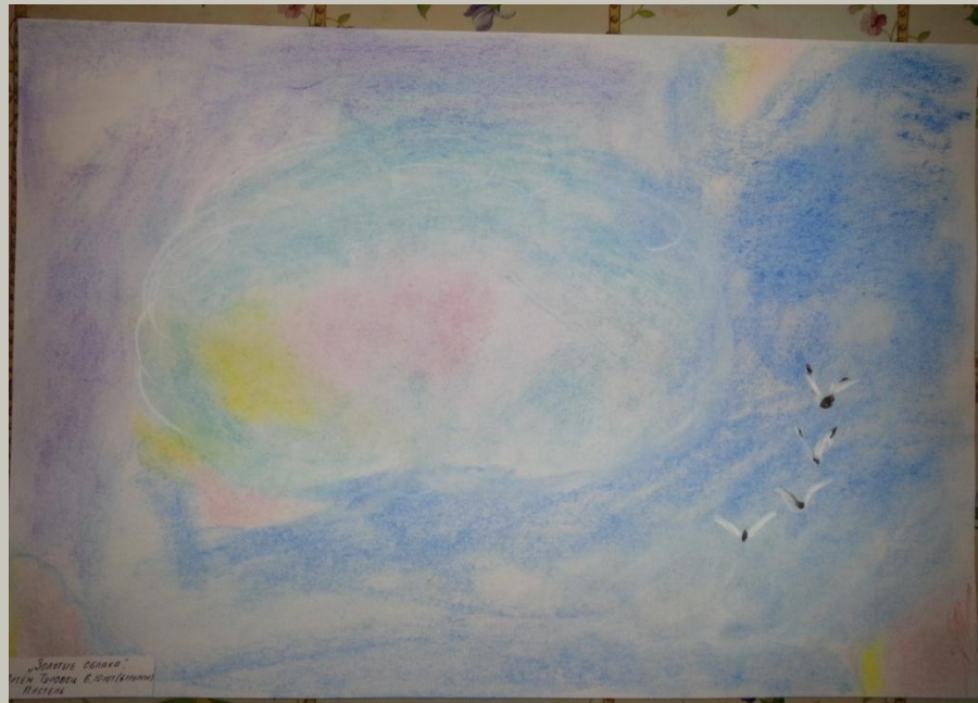
«Золотые облака» Подготовительная группа Работа кончиком пастели, растушевка