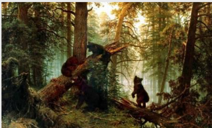
И. Шишкин «Утро в сосновом лесу»