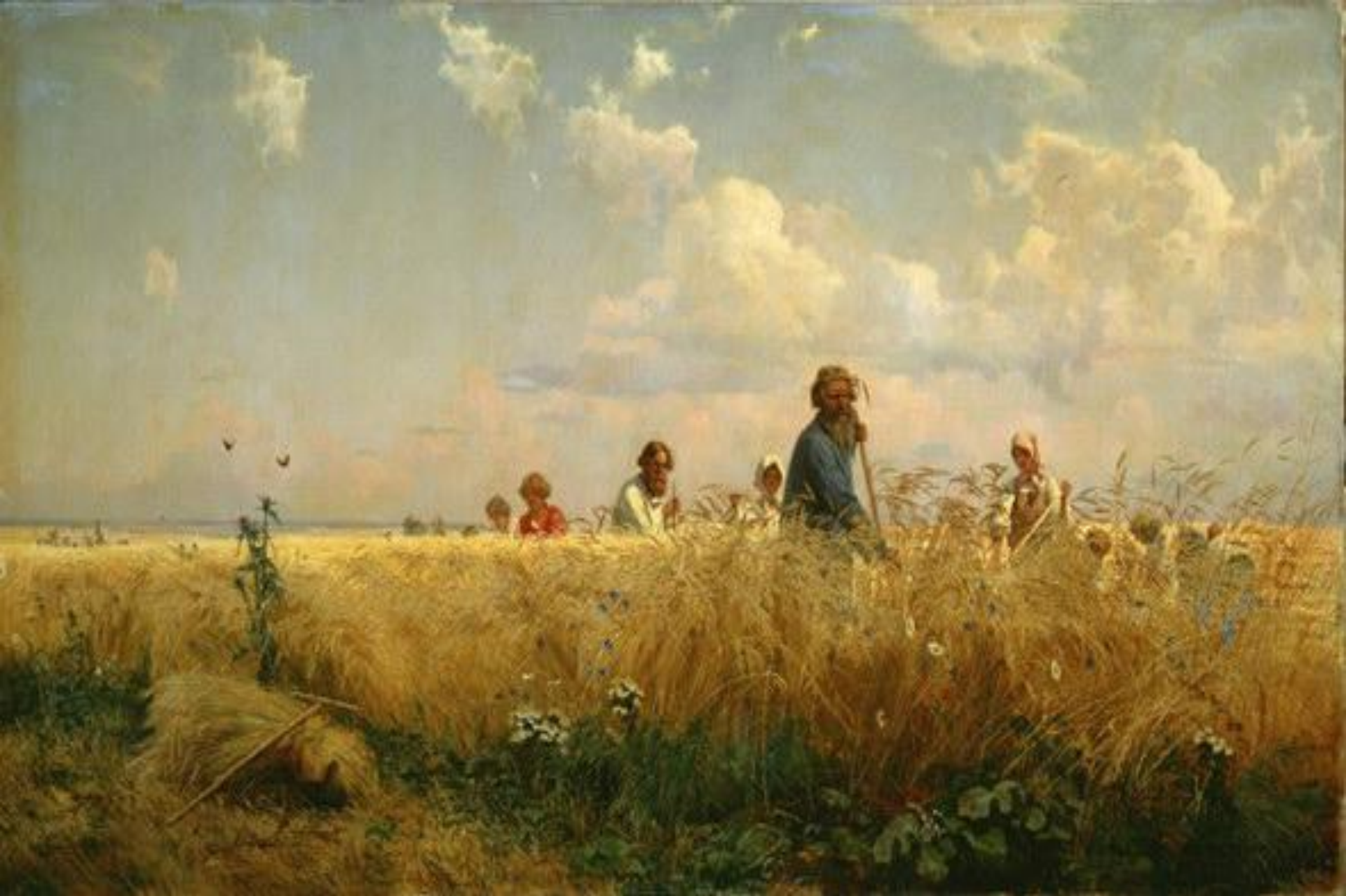
Г. Мясоедов «Косцы»