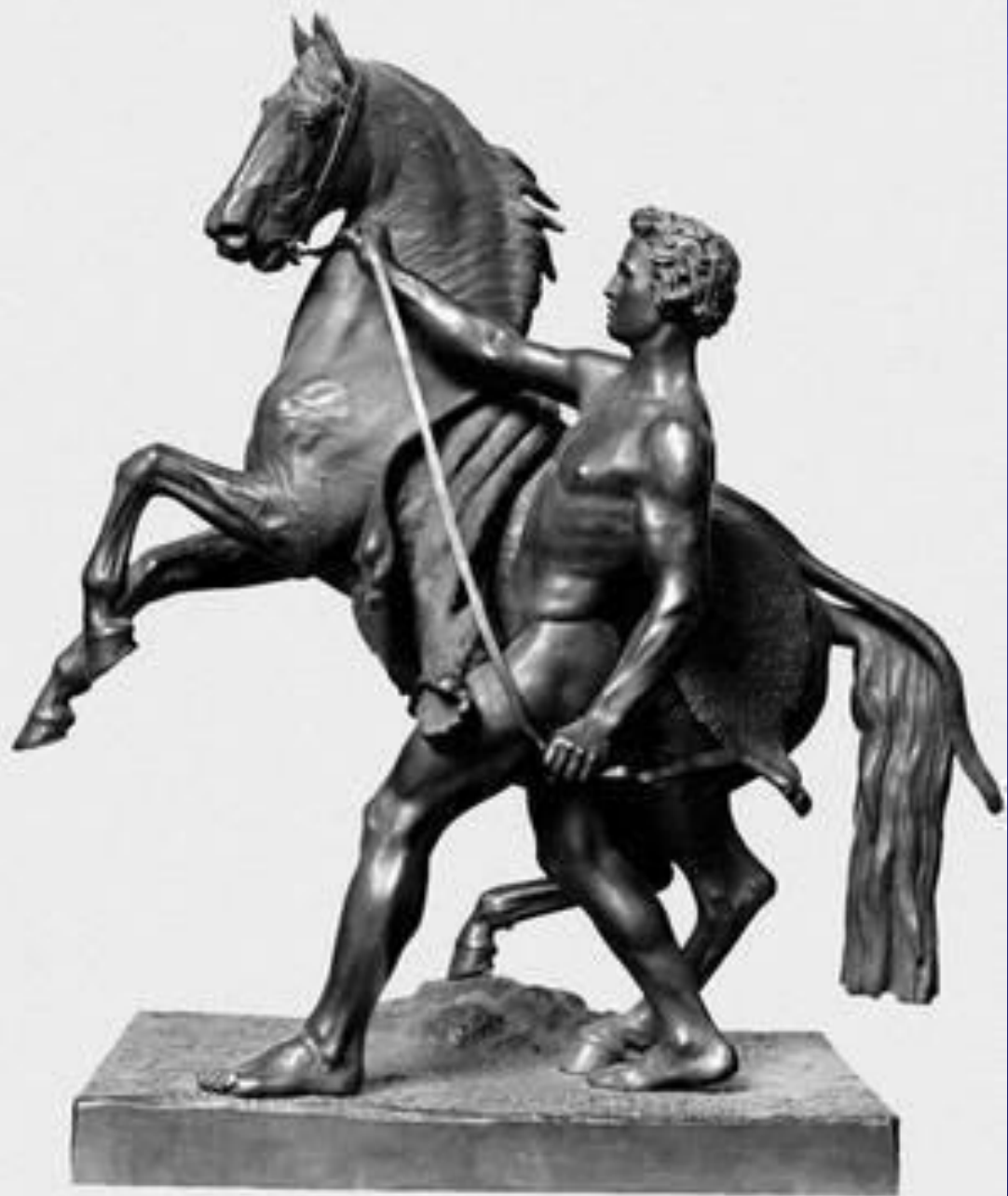
Клодт П. К. "Укротитель коня". Санкт-Петербург.