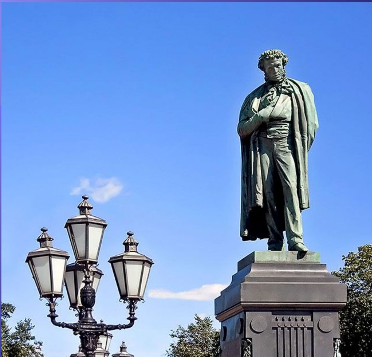
Памятник Пушкину, скульптор А.М. Опекушин. Москва.