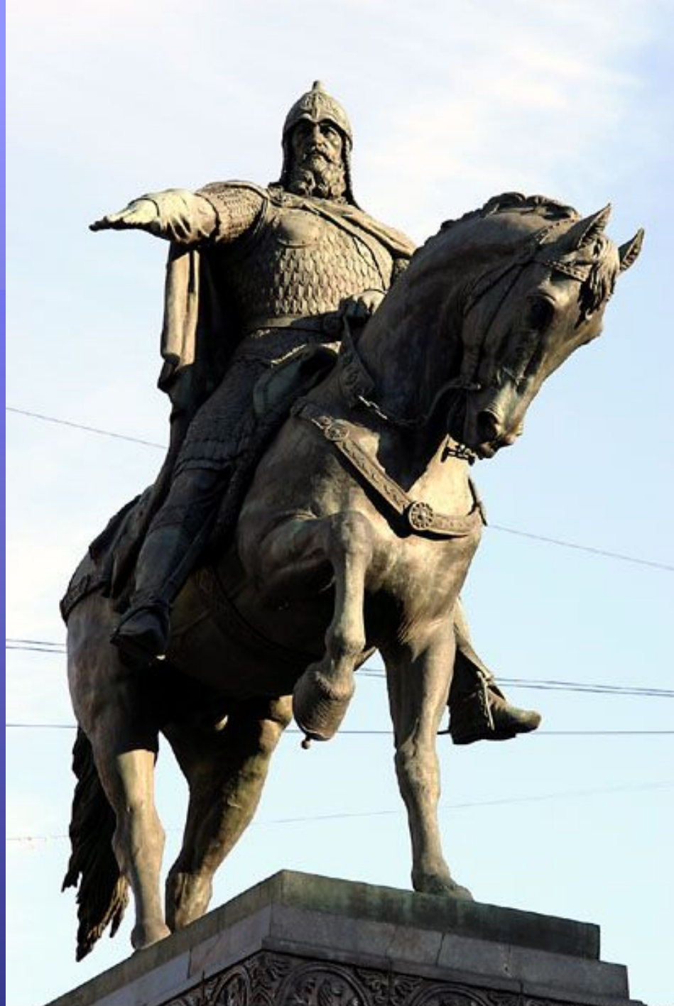
С. Орлов. Памятник Юрию Долгорукому установлен на Тверской площади ЦАО Москвы.