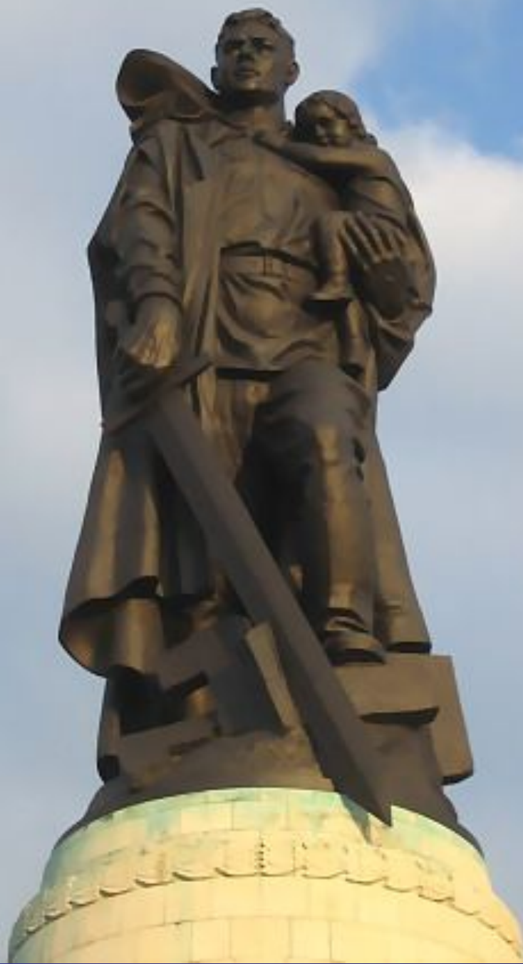
Е. Вучетич. Статуя советского воина-освободителя в Трептов парке, Берлин.