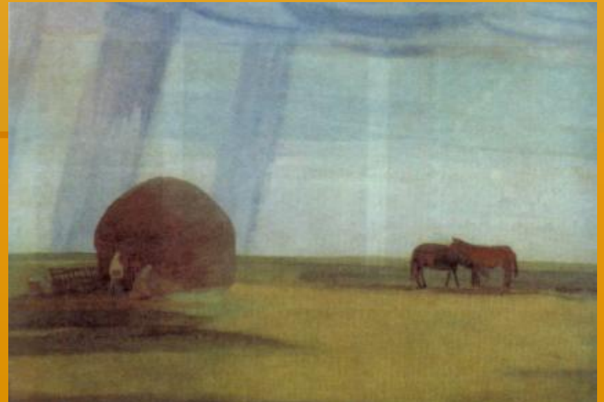
П. Кузнецов. Степь.