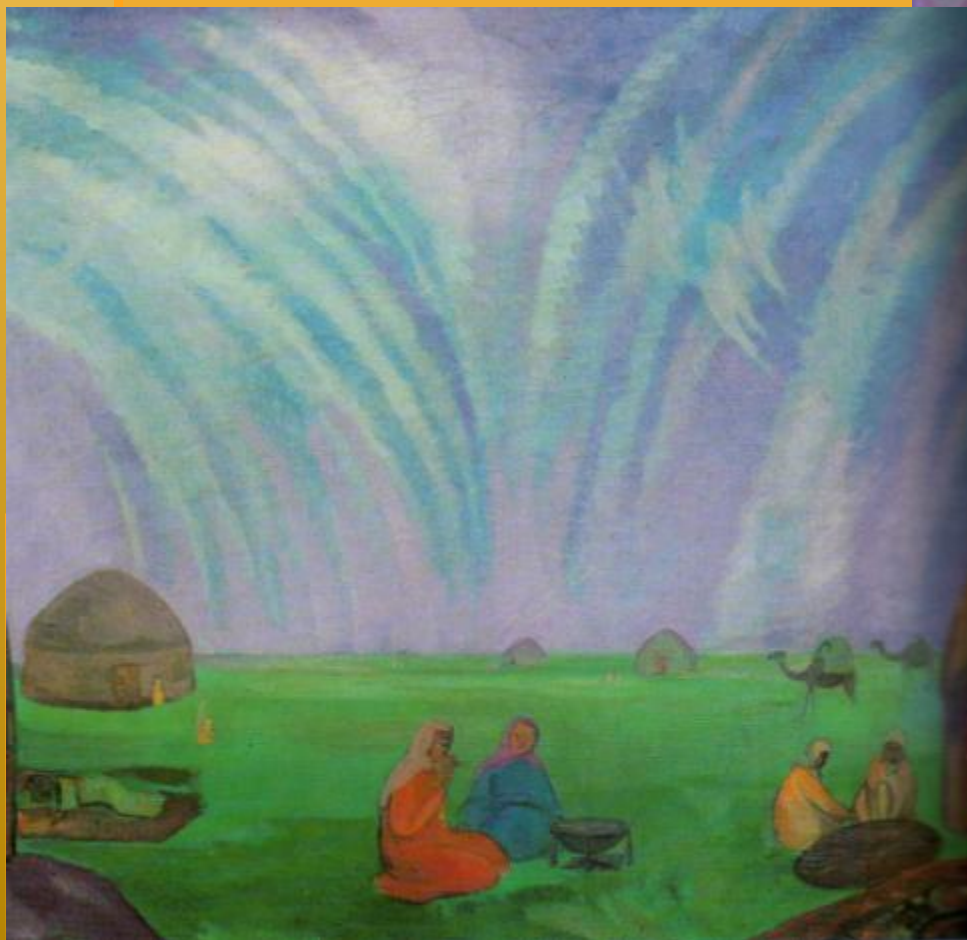
П.Кузнецов. Мираж в степи. 1912г.