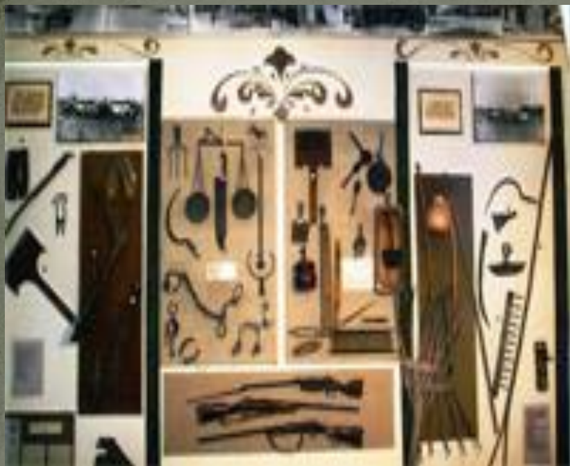
Экспозиция «Промыслы и ремесла на Кубани»