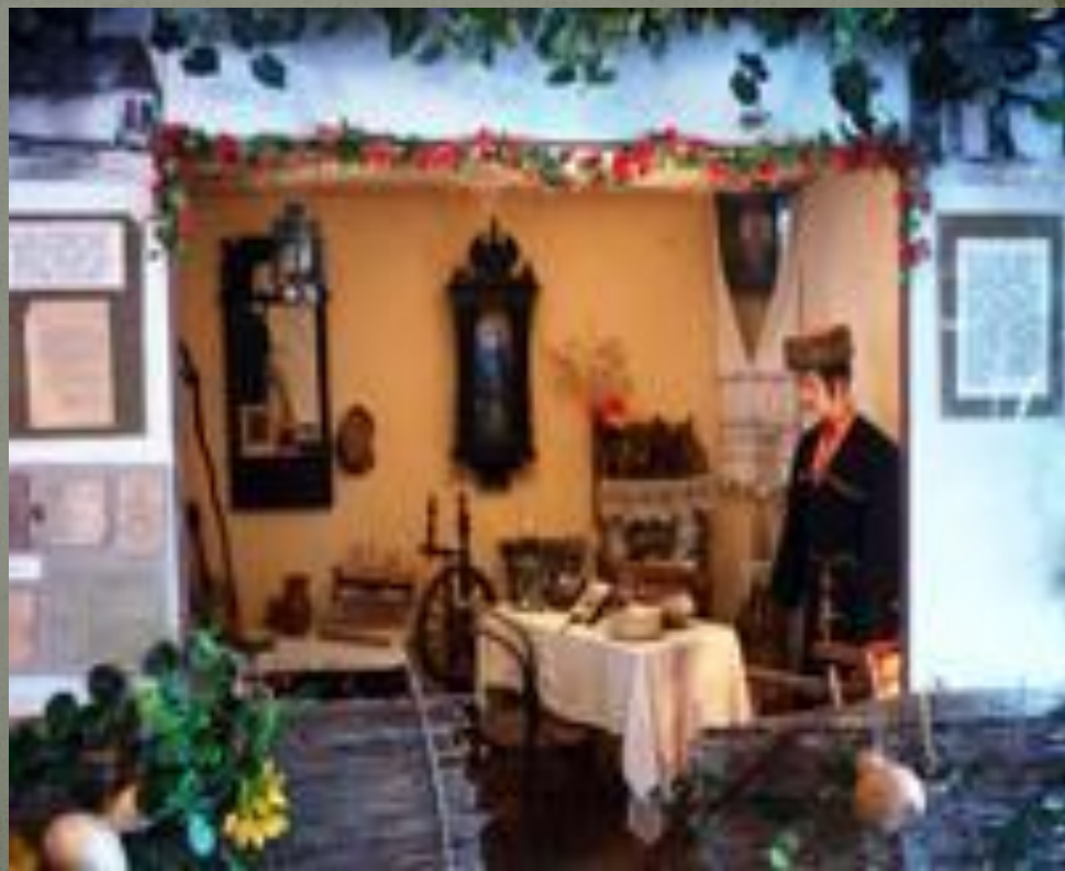
Этнографическая комната « Хата казака»