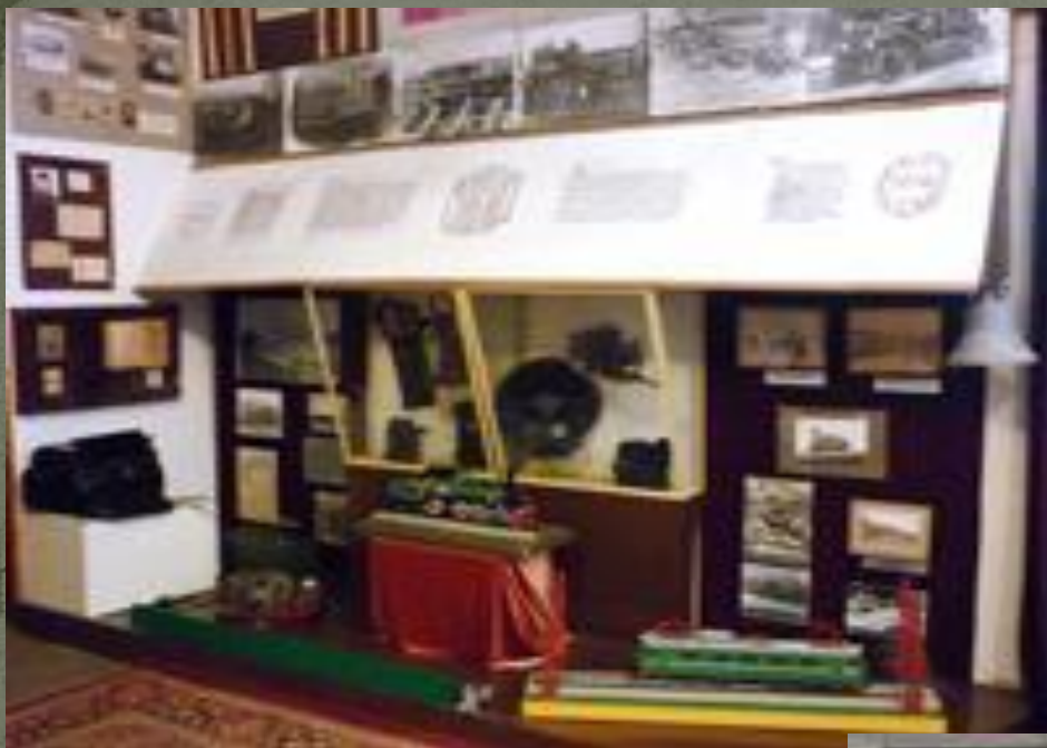
«Образование станции Кавказская»