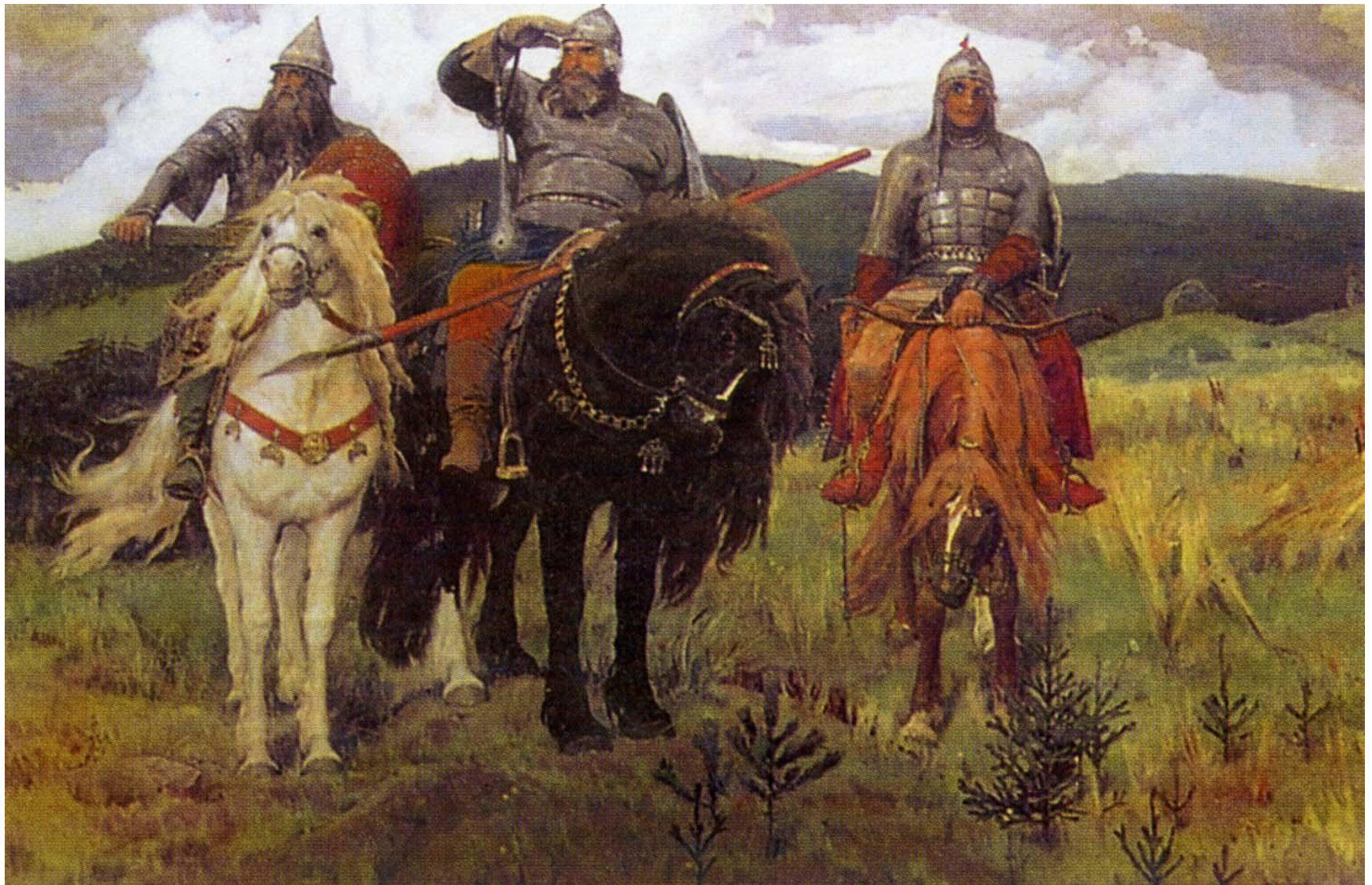
« Богатыри » (1898, Государственная Третьяковская галерея) Центральным произведением стал большой холст «Богатыри», изображающий трех былинных героев- величественного Илью Муромца, порывистого, гневного Добрыню Никитича и простоватого Алёшу Поповича- на заставе, высматривающих врага.