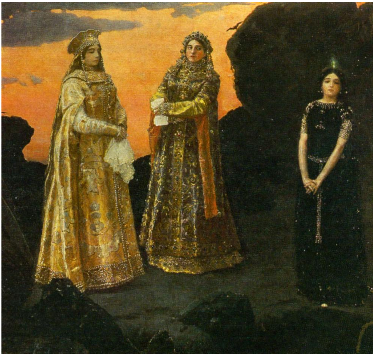
«Три царевны подземного царства» (1879 ГТГ, 1884 Киевский музей русского искусства)