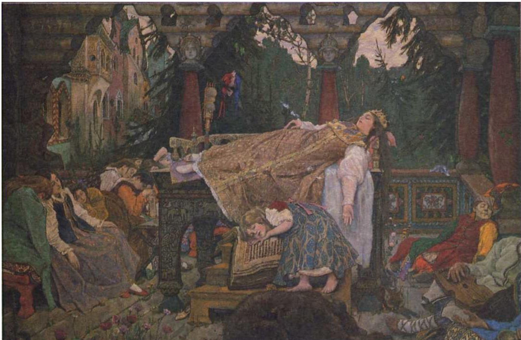
«Спящая царевна» (фрагмент)