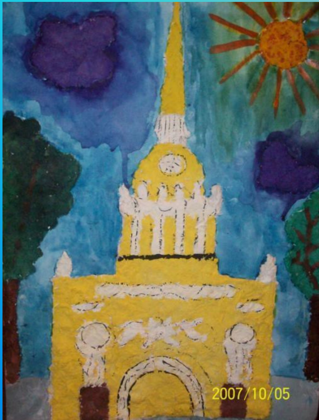
Рисунок сделала: Васильева Ксения