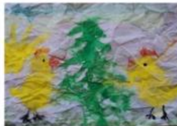
Цыплята у ёлки