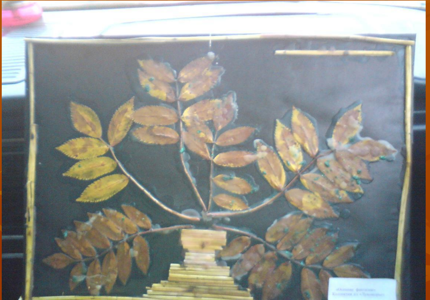
Железняк, фотоснимок