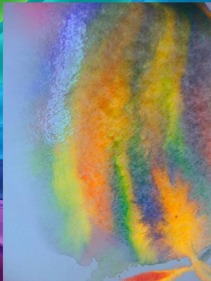
Рисунок тогда, получается, по сырому, когда в еще не засохший фон вкрапывается краска и разляпывается гаммоном или широкой кистью.