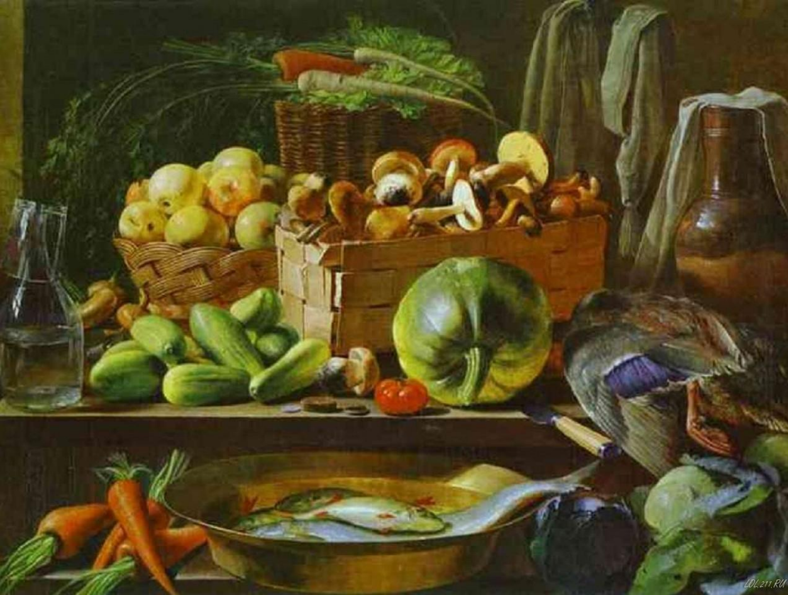
И. Хруцкий «Натюрморт с грибами»