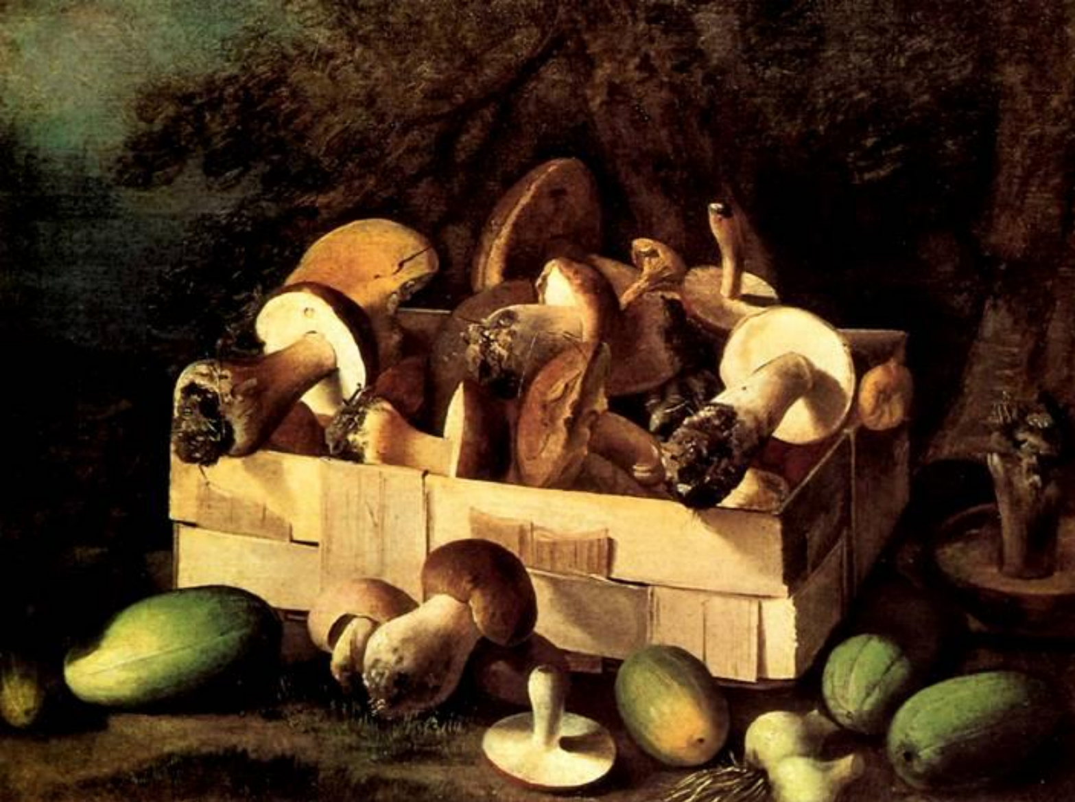
И. Хруцкий «Натюрморт с грибами»