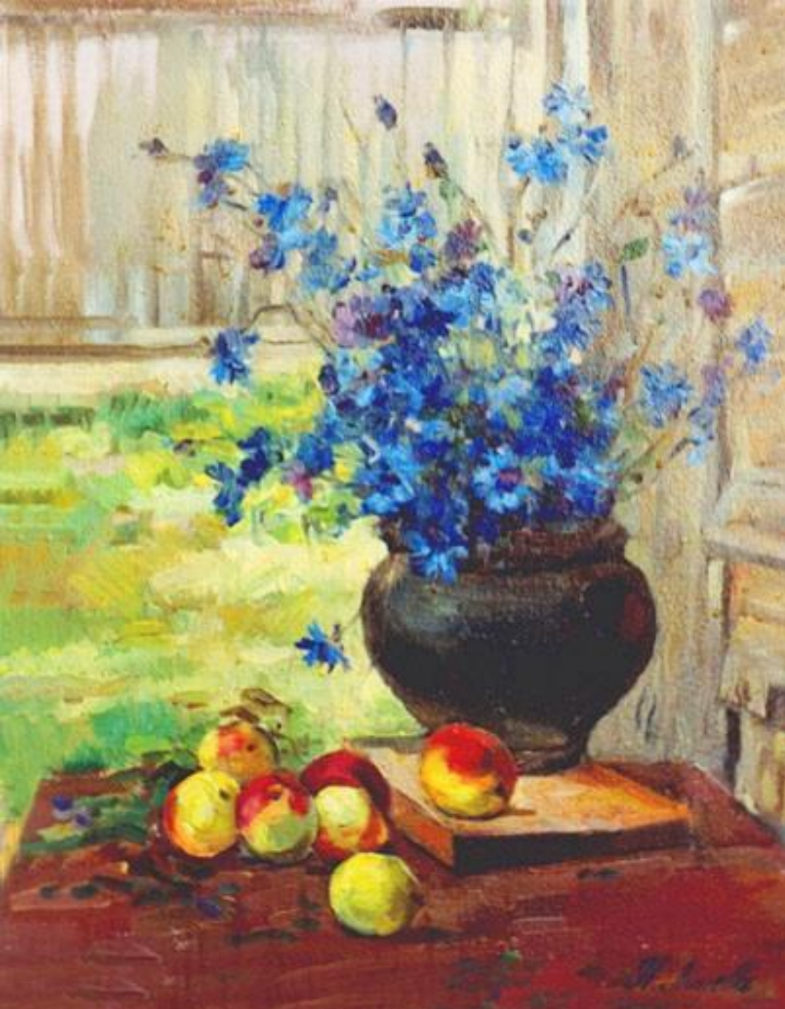
И. Левитан «Васильки»