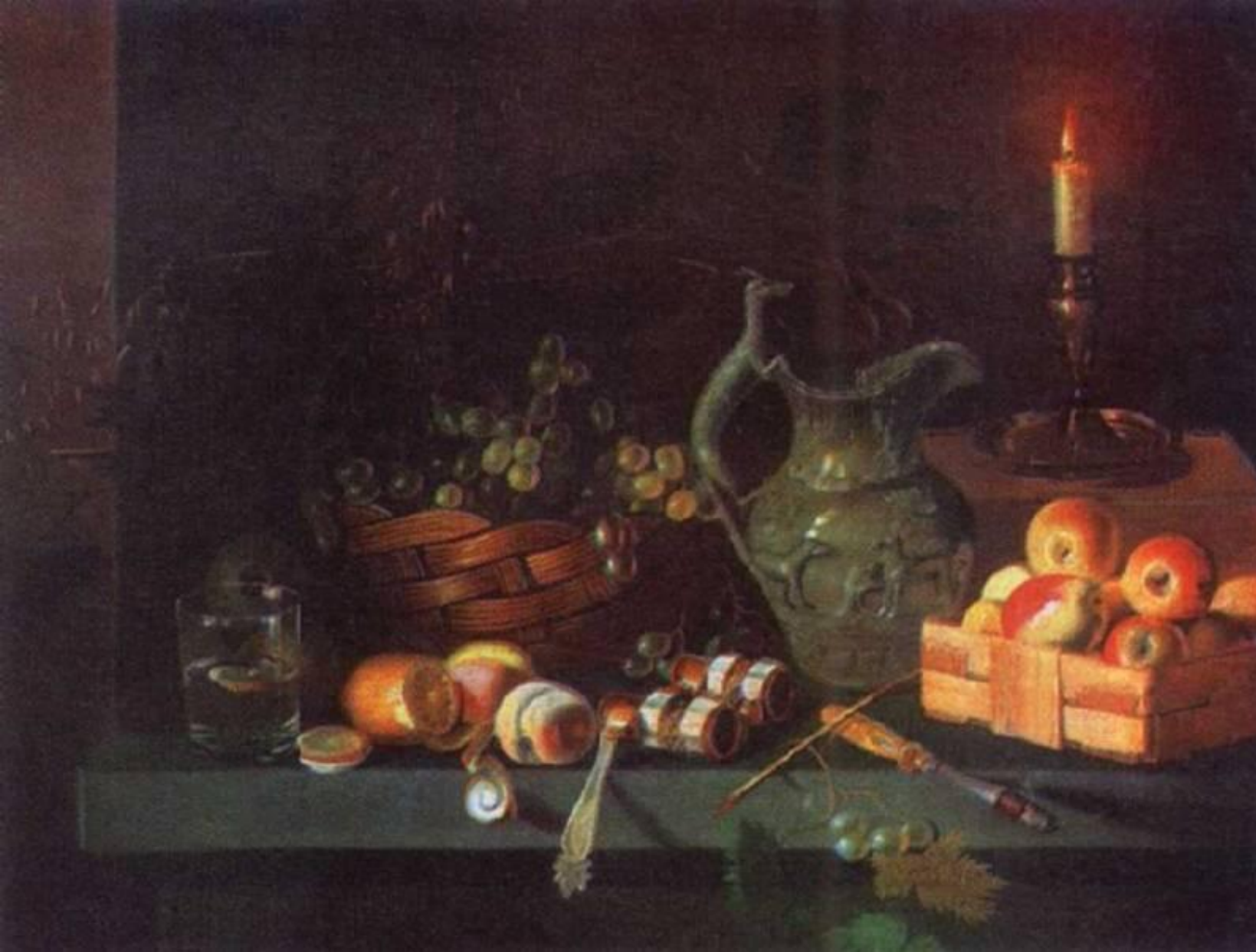
И. Хруцкий «Натюрморт со свечей»,