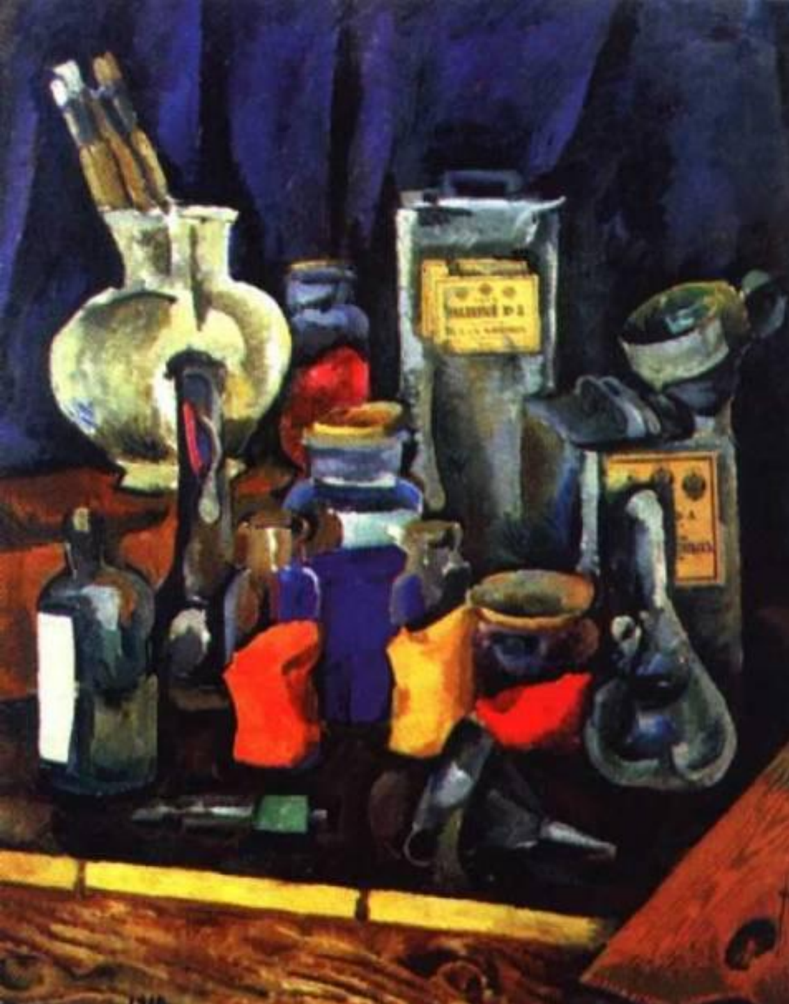
П. Кончаловский «Сухие краски»