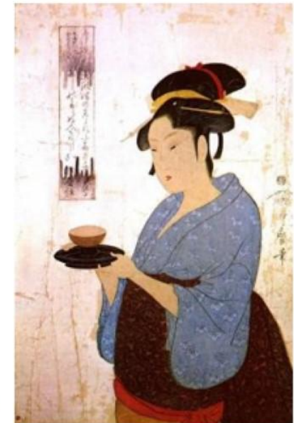
Девушка из чайного дома