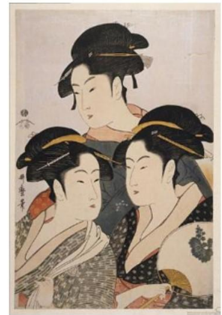
Три знаменитые красавицы

Китагава Утамаро (1753—1806) — японский художник, один из крупнейших мастеров укиё-э, во многом определивший черты японской классической гравюры периода ее расцвета в конце XVIII в.