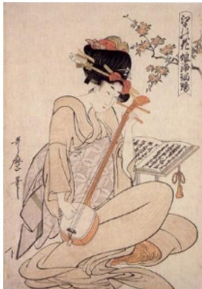
Цветы в Эдо