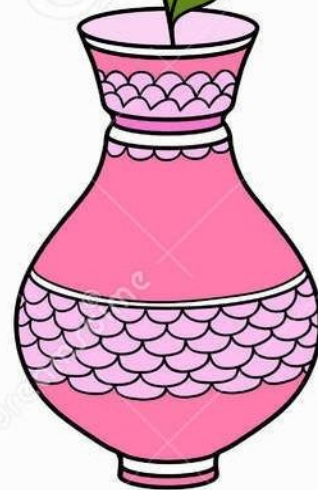
Эскизы для вазы