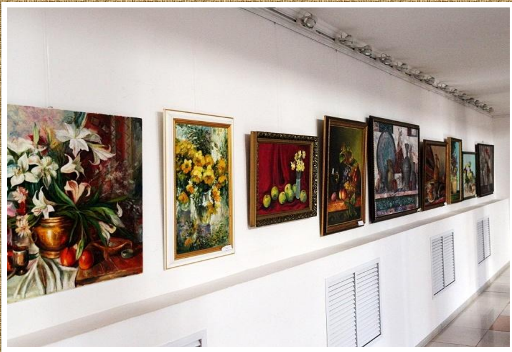
Жанр картины - «Натюрморт»