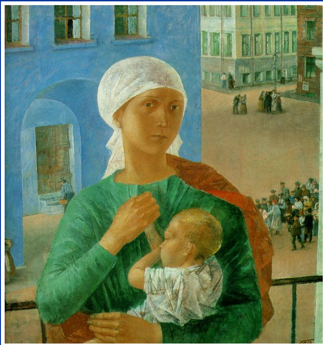
К.Петров – Водкин «1918 год в Петрограде» 1920 год

В этой картине художник необычным образом сочетает бытовой жанр с символическим образом матери, который раскрывается через тему материнства в истории искусства. Вспоминается и иконописные образы Богоматери и образ Мадонны в европейской живописи. Фоном служат реалии жизни Петербурга революционной поры.