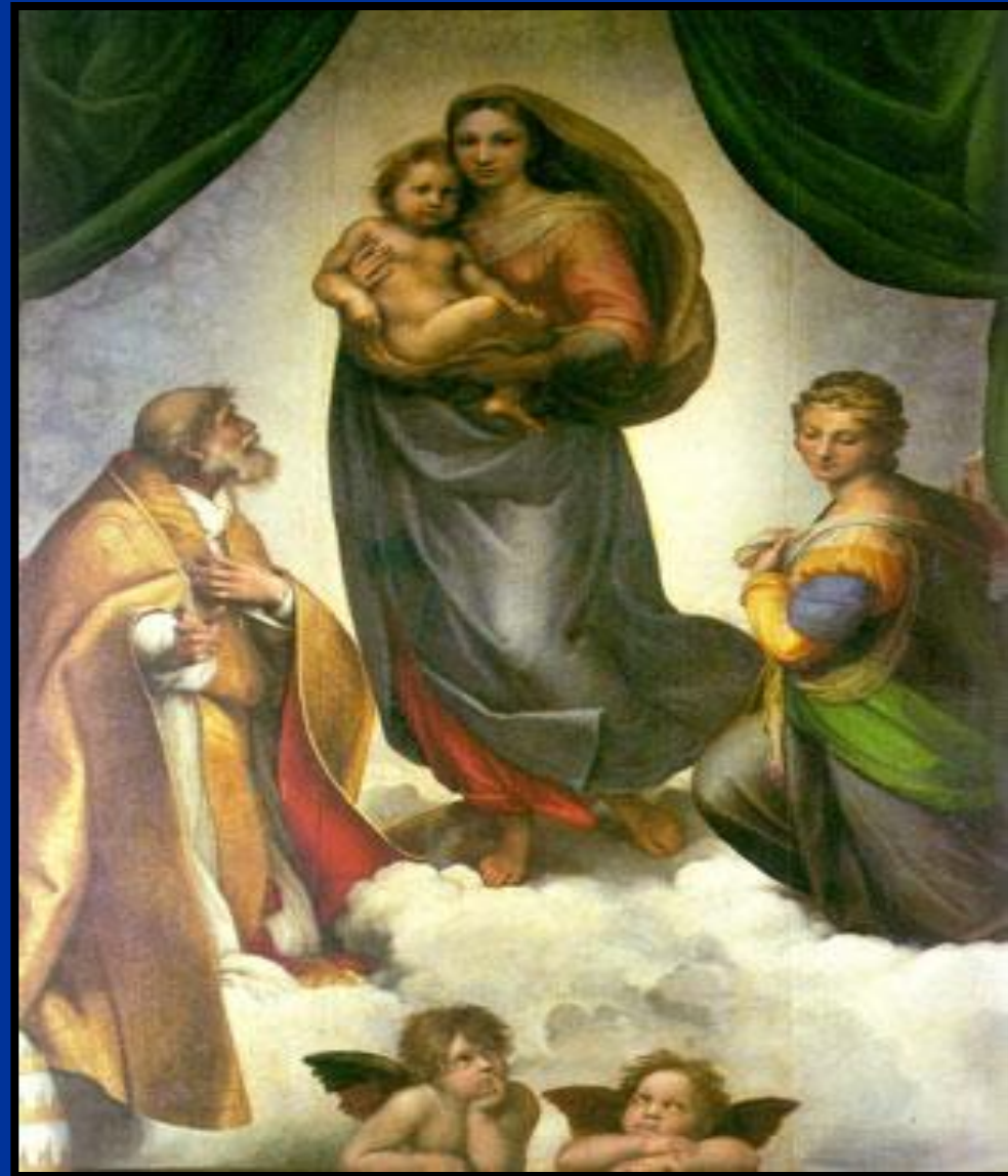
Рафаэль Сикстинская Мадонна 1512 год

В глубине картины, на заднем плане, едва различимые в золотой дымке, смутно угадываются лица ангелов, усиливая общую возвышенную атмосферу. Взгляды и жесты двух ангелов на переднем плане обращены к Мадонне. Присутствие этих крылатых мальчиков, больше напоминающих мифологических амуров, придает полотну особую теплоту и человечность.