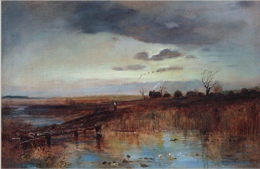
Осень. Деревушка у ручья Художник Саврасов А. К.