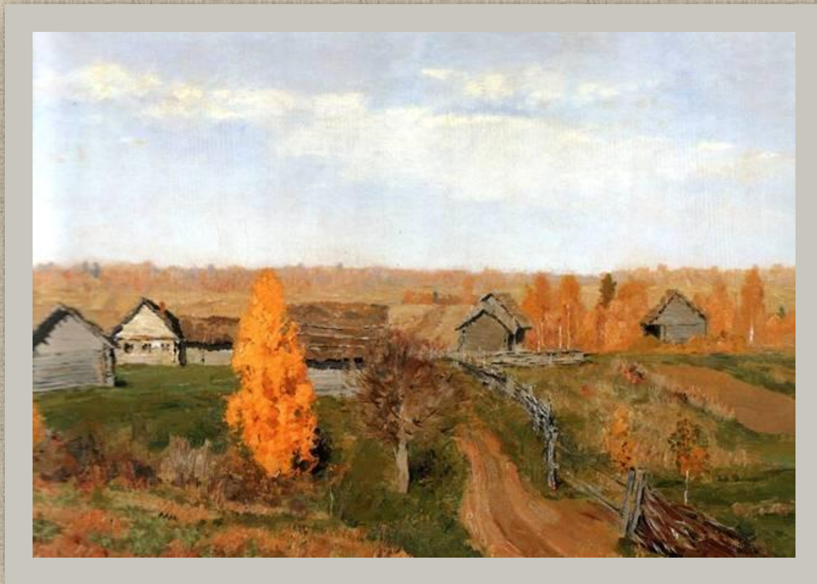
Левитан И.И. Золотая осень. Слободка 1889