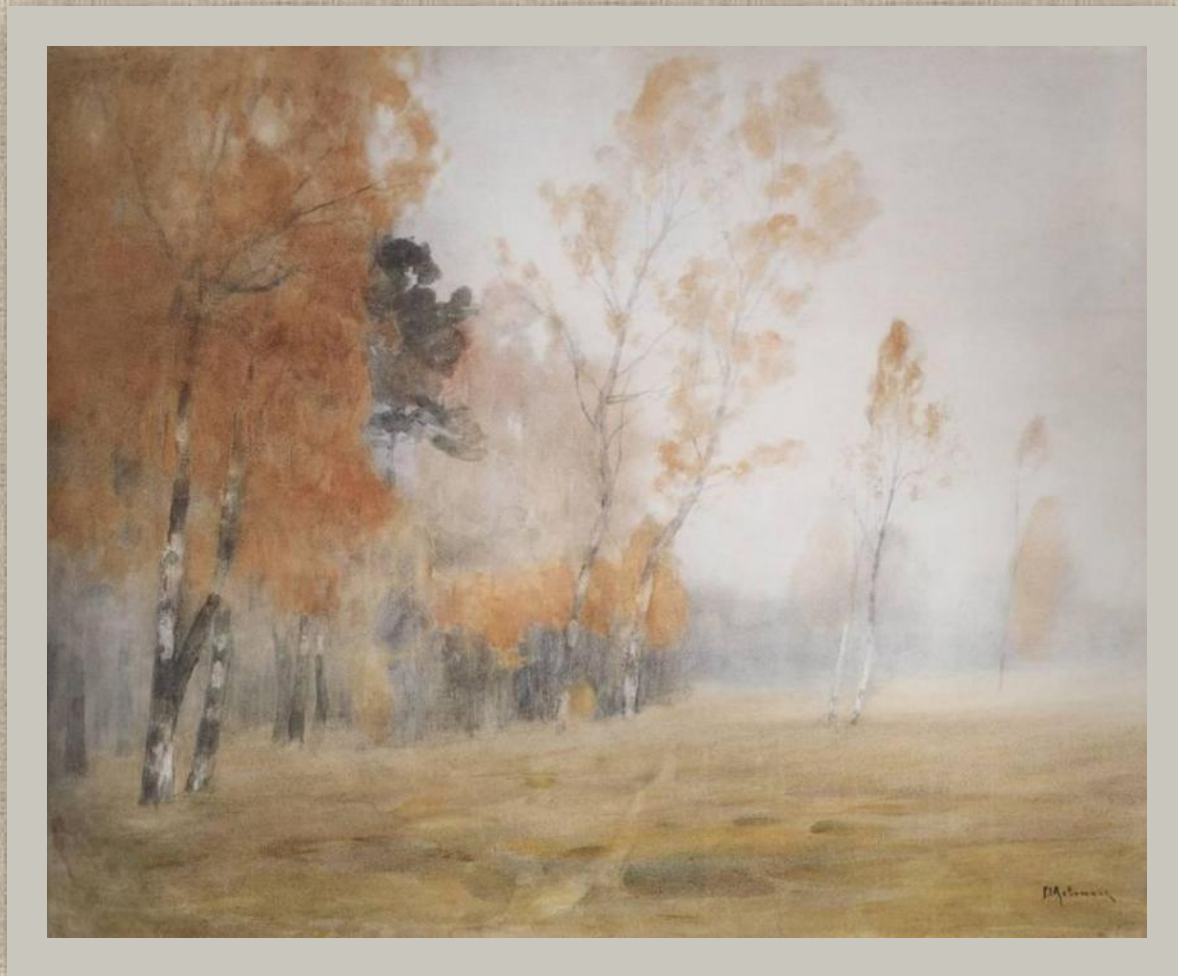
Туман. Осень. 1899 Художник Левитан И. И.