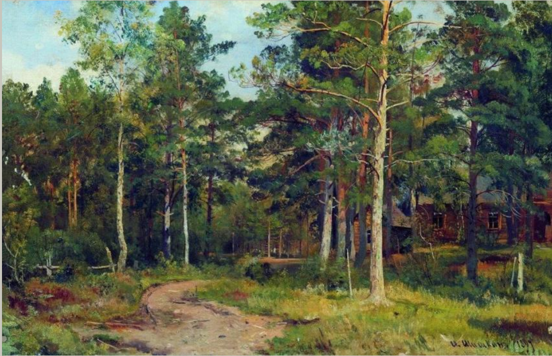
Осенний пейзаж. Дорожка в лесу Художник Шишкин И.И.