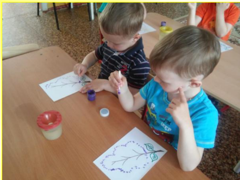
Рисование ватной палочкой