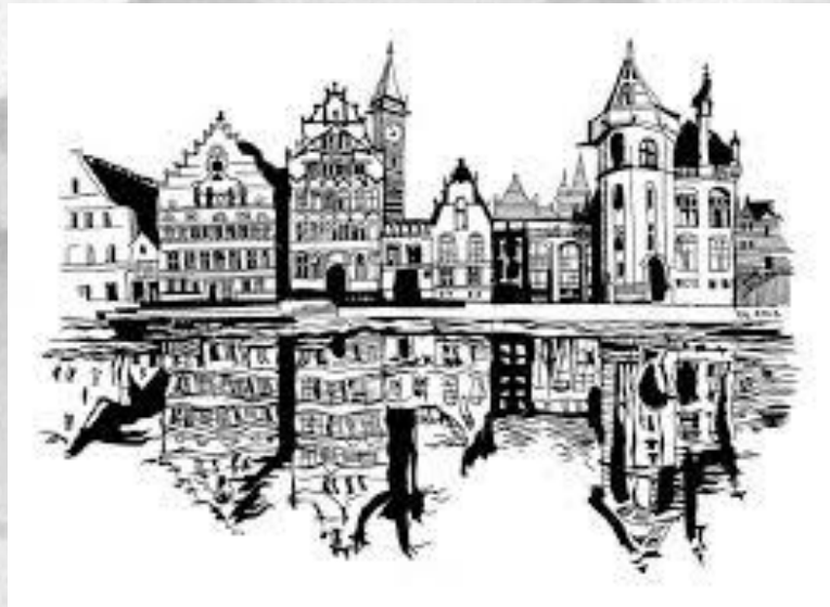
Рисунок является основой всех видов графики и других видов изобразительного искусства.

Рисунок относится к уникальной графике потому, что каждый рисунок является единственным в своем роде.