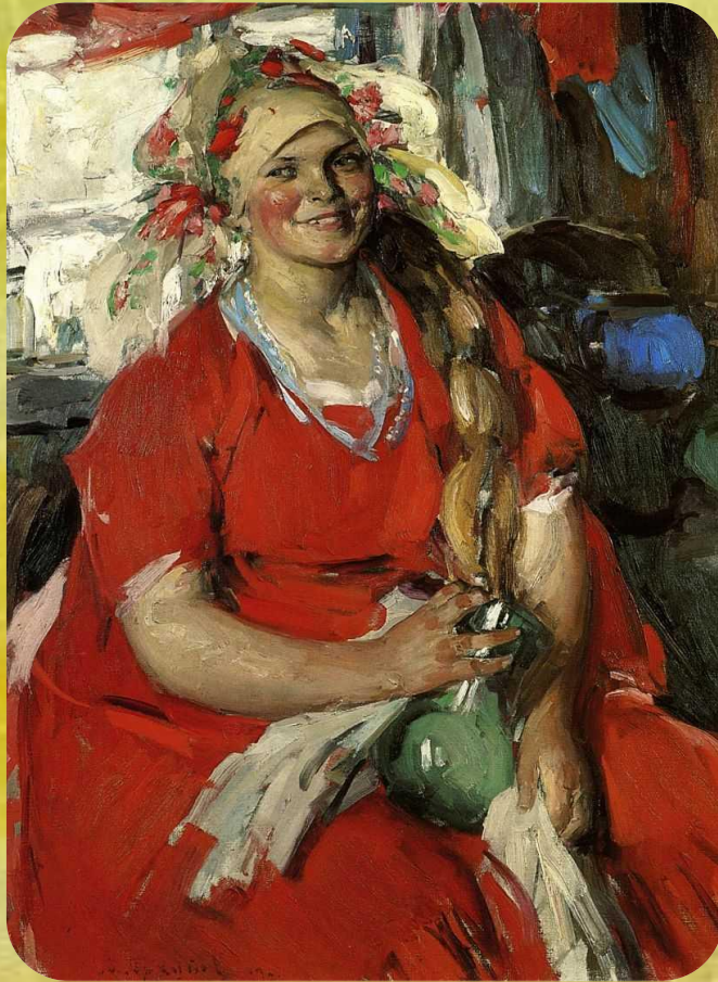
А. Архипов «Молодая крестьянка в красной кофте»