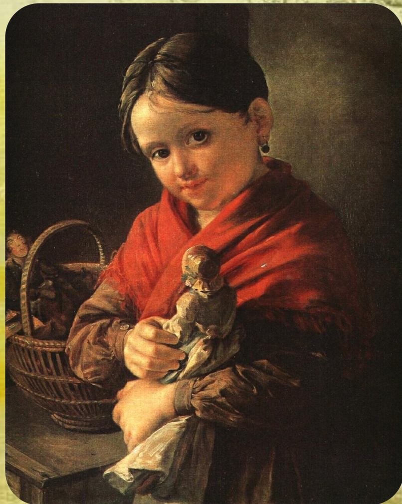
В. Тропинин «Девочка с куклой»