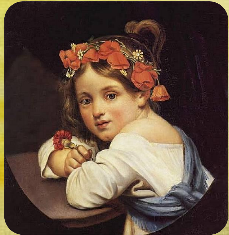
О. Кипренский «Девочка в маковом венке»