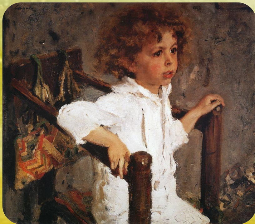
В. Серов «Мика Морозов»